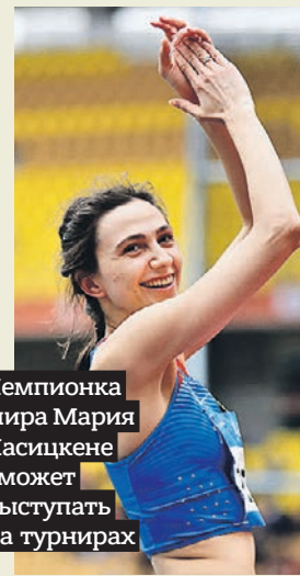
Чемпионка мира Мария Ласицкене сможет выступить на турнирах

Вчера Международная ассоциация легкоатлетических федераций одобрила заявки 35 спортсменов из России на выступление в международных соревнованиях в нейтральном статусе после решения комиссии по допинг-контролю. Всего допуск для выступления в международных турнирах получили 62 наших спортсмена.