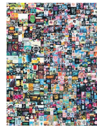
Фрагмент цифровой картины художника Майка Винкельманна

Это коллаж из пяти тысяч цифровых изображений, которые художник создавал ежедневно в течение 13 лет. Продажа картины сделала Винкельманна одним из самых дорогих художников современности. А для аукционного дома это стало первым случаем выставления на торги полностью цифрового произведения.