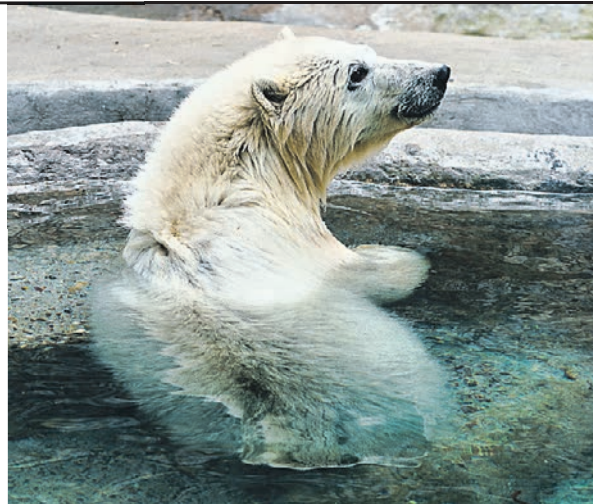
7 июня 2021 года. Новую питомицу Московского зоопарка москвичи назвали Хатангой.