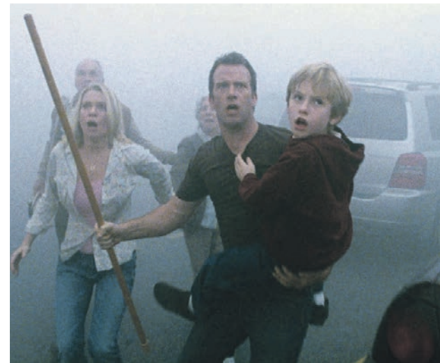
Кадр из фильма «Мгла», в котором город накрывает туман, скрывающий настоящий ужас