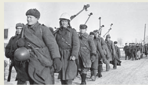
8 января 1942 года – 3 марта 1942 года. Ржевско-Вяземская операция Операция имела важное значение в ходе общего наступления Красной армии зимой 1941 – весной 1942 года.