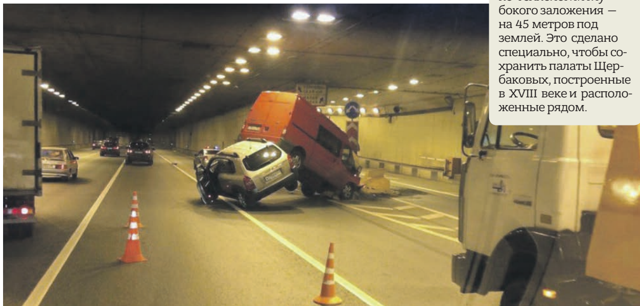
3 августа 2016 года. Загадочная авария в Лефортовском тоннеле, не попавшая ни на одну видеокамеру. Микроавтобус столкнулся с внедорожником. Чудом обошлось без жертв