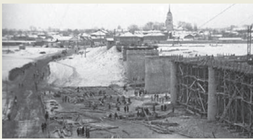
7–25 декабря 1941 года. Елецкая наступательная операция В результате операции советские войска нанесли поражение немецкой 2-й армии и освободили города Елец и Ефремов.