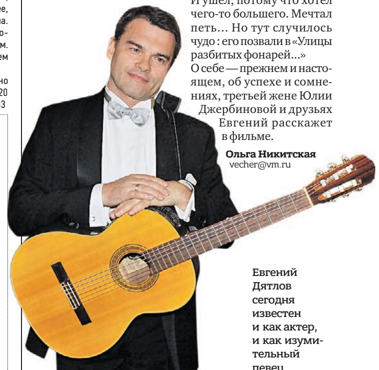
Евгений Дятлов сегодня известен и как актер, и как изумительный певец