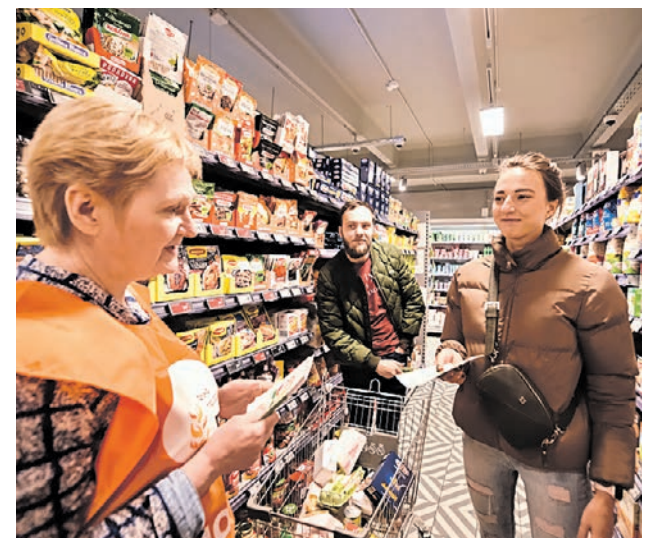
Волонтер Фонда продовольствия «Русь» рассказывает покупателям «Пятерочки», как принять участие в акции