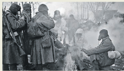
17 декабря 1941 года – 5 января 1942 года. Калужская наступательная операция В ночь на 30 декабря немцы были выбиты из Калуги и отошли к Юхнову, Новый год город встречал освобожденным.