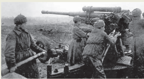
6–16 декабря 1941 года. Тульская наступательная операция Войска противника были отброшены на 130 км к западу. Создались предпосылки для действий в направлении Калуги.