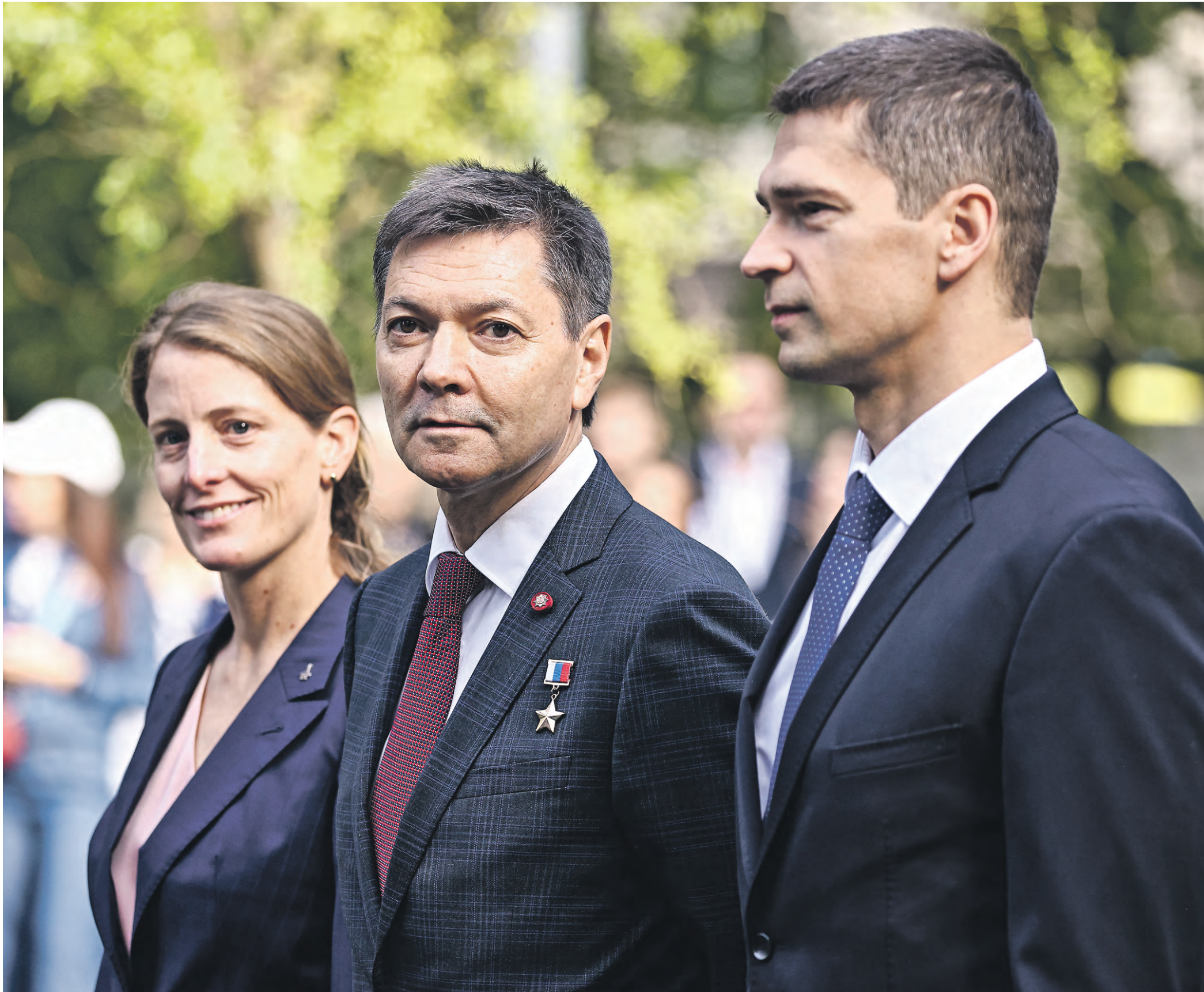
точка Сегодня точку в номере ставят члены основного экипажа корабля «Союз МС-24» МКС-70/71 (слева направо): астронавт NASA Лорел О'Хара, космонавты Роскосмоса Олег Кононенко и Николай Чуб. Покорителей внесемного пространства запечатлели в Центре подготовки космонавтов имени Ю. А. Гагарина во время проводов основного и дублирующего экипажей пилотируемого корабля «Союз МС-24» 70-й и 71-й экспедиции на Международную космическую станцию. Теперь астронавтов ждет предстартовая подготовка на космодроме Байконур. Сама отправка транспортного пилотируемого корабля «Союз МС-24» запланирована на 15 сентября 2023 года. В качестве командира корабля выступит Олег Кононенко, который отправляется уже в пятую свою экспедицию на МКС. Космонавтам предстоит провести более 60 экспериментов в космосе, из которых семь — принципиально новые.