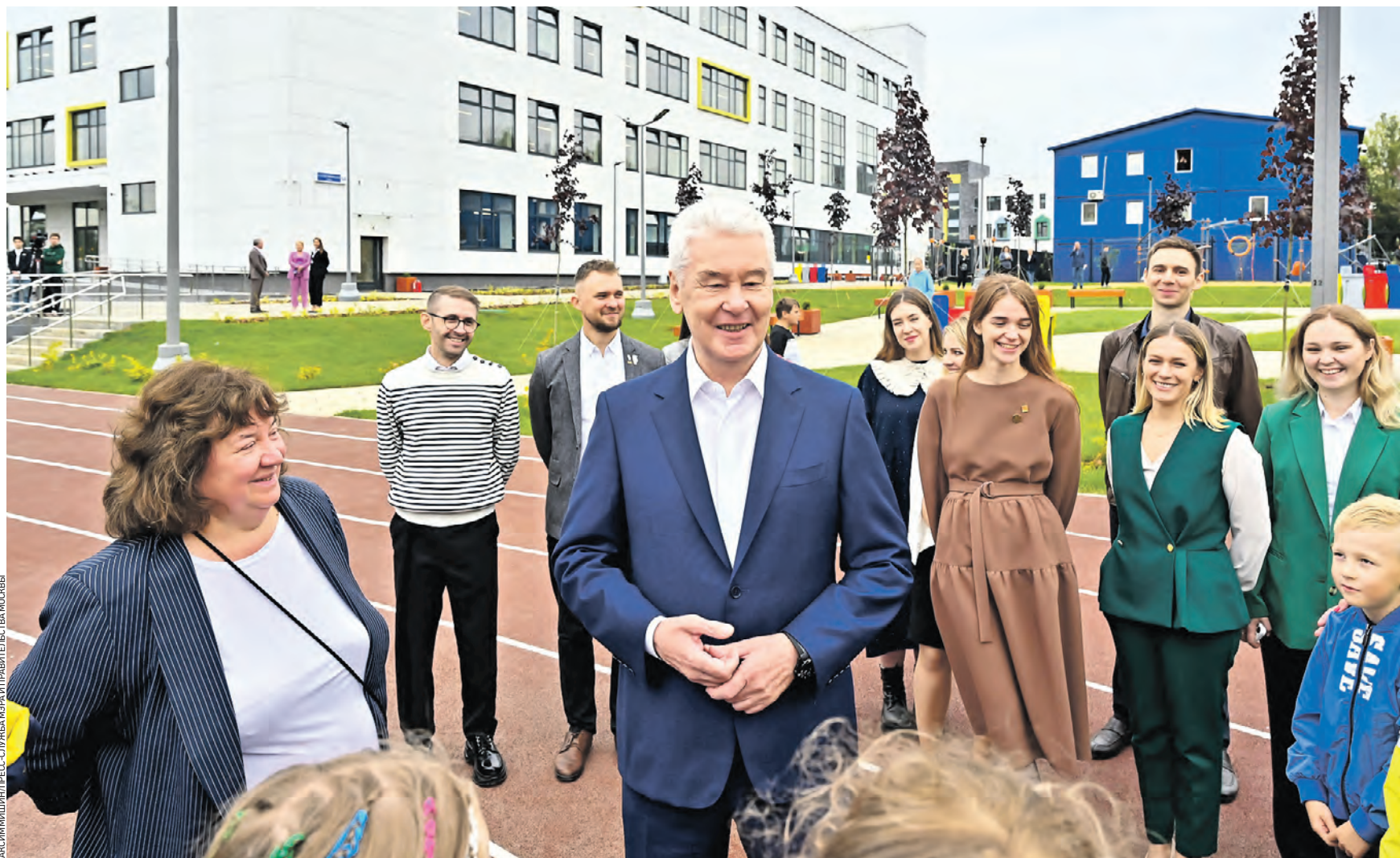
Вчера 11:08 Мэр Москвы Сергей Собянин (в центре) поздравил учеников и их родителей, а также учителей школы «Перспектива» с открытием нового учебного корпуса. Ребята придут сюда на уроки уже 1 сентября. Школьный двор благоустроили. Здесь поставили игровые и спортивные площадки

Первоклассный результат Учебный корпус, рассчитанный на 1100 учеников, построили на территории школы «Перспектива». В новом здании будут заниматься ученики 7–11-х классов. Специально для них оборудовали кабинеты для предпрофессионального образования, в том числе по естественно-научным направлениям. Также в школе откроют мастерские по рисунку, композиции и декору, 3D-моделированию, созданию скульптур и макетов. — Школа получилась действительно первоклассная, оснащенная всем необходимым, — подчеркнул мэр. Перед входом оборудовали велопарковку. В школьном дворе обустроили спортив-