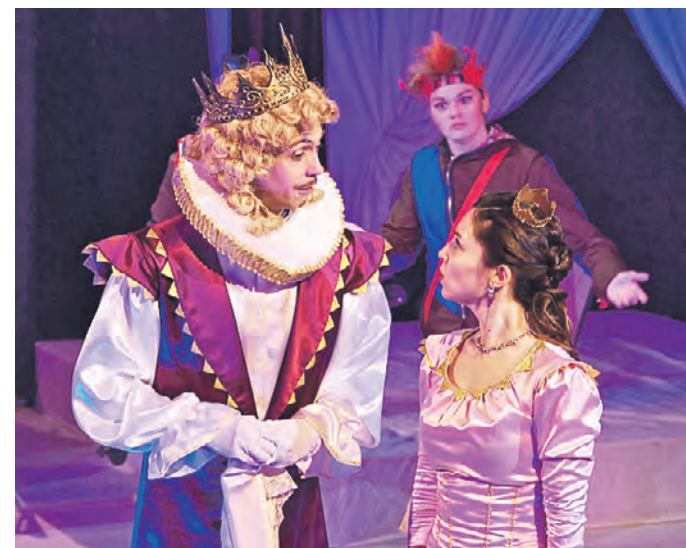
2023 год. Фрагмент документального фильма «Куклы, книги, война» о деятелях культуры Донбасса

С первых же кадров фильм вызывает ощущение тревоги и одновременно гармонии, такое сочетание часто бывает признаком высокого искусства. Мастерски выстроенные кадры, тонко подобранная музыка и, главное, люди, которые говорят и ведут себя перед камерой так, как не сыграет ни один профессиональный актер. Но эта естественность обманчива. Чтобы добиться такой подлинной искренности, нужно найти, выбрать