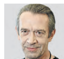
ВЛАДИМИР МАШКОВ ХУДОЖЕСТВЕННЫЙ РУКОВОДИТЕЛЬ МОСКОВСКОГО ТЕАТРА ОЛЕГА ТАБАКОВА

За долгие годы в театральном мире я понял, что русский зритель очень недоверчивый. Тем более за деньги. И мы будем делать все возможное, чтобы зрители получили те впечатления, которые было задумано передать. В этом сезоне у нас большие гастрольные планы. Мы начинаем его в Санкт-Петербурге, а впереди у нас Екатеринбург, Киров, Пермь, Казань. А еще нас снова пригласили в Херсонес. Это будет большой выезд, мы привезем туда спектакль «Стрости по Бумбарашу». Как многие знают, я часто жаловался на состояние нашей исторической сцены: там не было ремонта почти 40 лет. Там небольшой зал, и артисты находятся очень близко к зрителю. Все спектакли, которые там ставятся, очень точно и внимательно сделаны. Но вот наконец-то нам повезло! Мы приведем ее в порядок, чтобы и зрителям было у нас хорошо, и репетировать было бы можно. Ведь это место нашей силы.