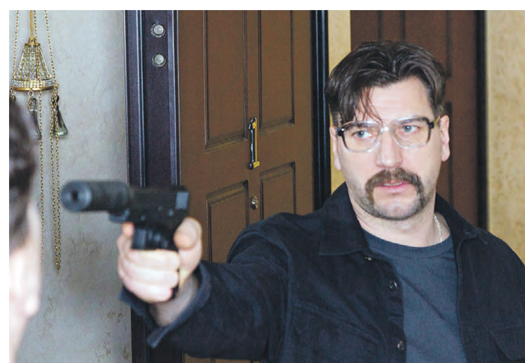
Кадр из сериала «Киллер»: Александр Устюгов сыграл в нем роль человека, которого обстоятельства вынуждают совершать не самые прекрасные поступки

Для начала разберемся, что это такое — данный формат. По сути это особое направление видеопромышленности. Словосочетание High Definition (HD) переводится с английского как «высокая четкость». Как и в случае с видеосигналом стандартной четкости, в HD могут транслироваться программы спутникового, кабельного или эфирного телевидения и храниться видеоданные, до того записанные на цифровые носители. Первое направление принято называть высокой четкостью, а второе — HDV (High Definition Video — видео высокой четкости). Настоящим HD считается видеоряд с разрешением не менее 1280×720 точек, а в идеале — 1920×1080 точек. Для сравнения: мерилом стандартной четкости является формат DVD с разрешением 720×576 (PAL) или 720×480 (NTSC). Помимо очевидно более высокого разрешения, формат HD использует более совершенные алгоритмы кодирования звука. То есть если совсем коротко: будет лучше, четче, ярче и все такое. Что же касается нового сезона, о своих планах на который НТВ нам также любезно рассказал, то в первую очередь, конечно же, телеканал презентует сериалы: они уверенно удерживают интерес зрителей, в первом полугодии