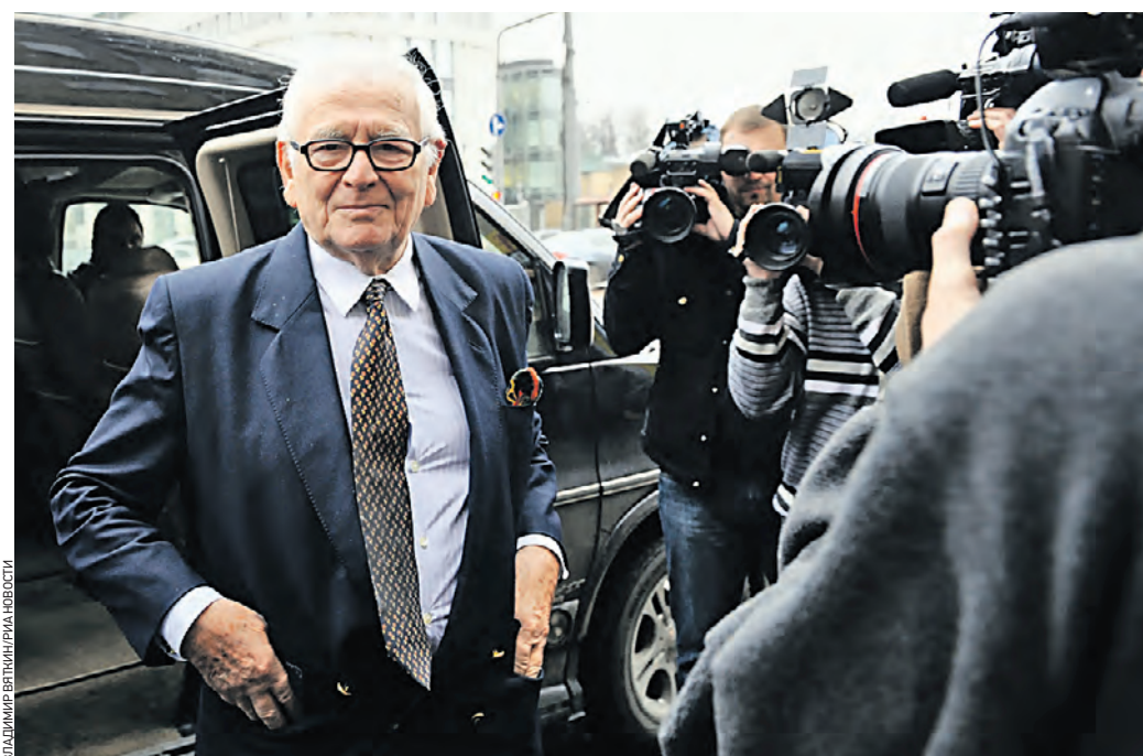
9 ноября 2009 года. Модельер Пьер Карден посещает библиотеку киноискусства имени С. М. Эйзенштейна. Кураторе часто бывал в Москве с рабочими и дружескими визитами