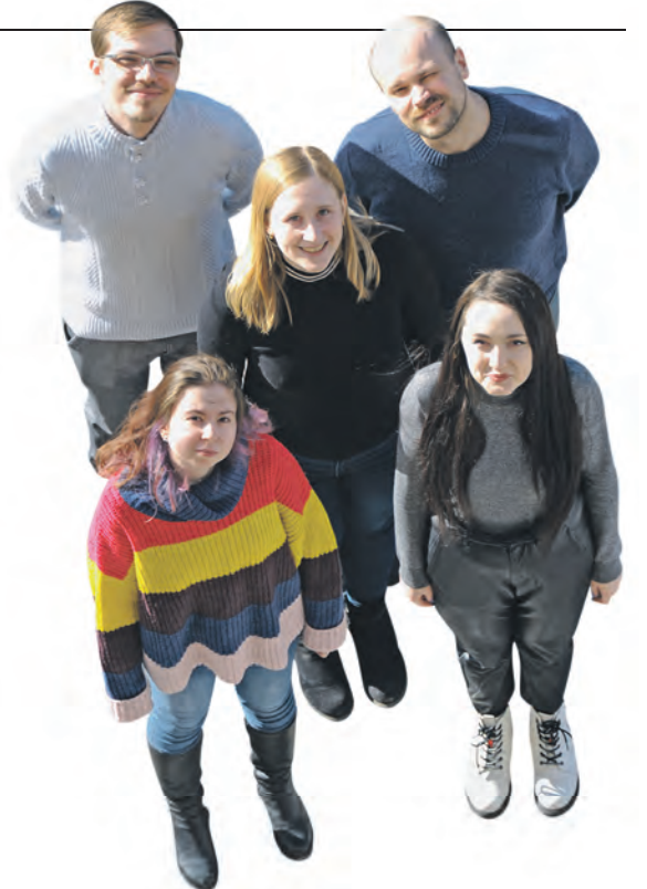
Корреспонденты «ВМ» АЛЕКСАНДР КУДРЯВЦЕВ, ИРИНА КОВГАН, АНДРЕЙ КАЗАКОВ, ЮЛИЯ ПАНОВА, ВЕРНИКА УШАКОВА.