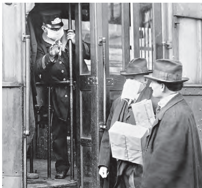
1918 год. Вагоновожатый в Сиэтле не пускает в трамвай людей без защитных масок