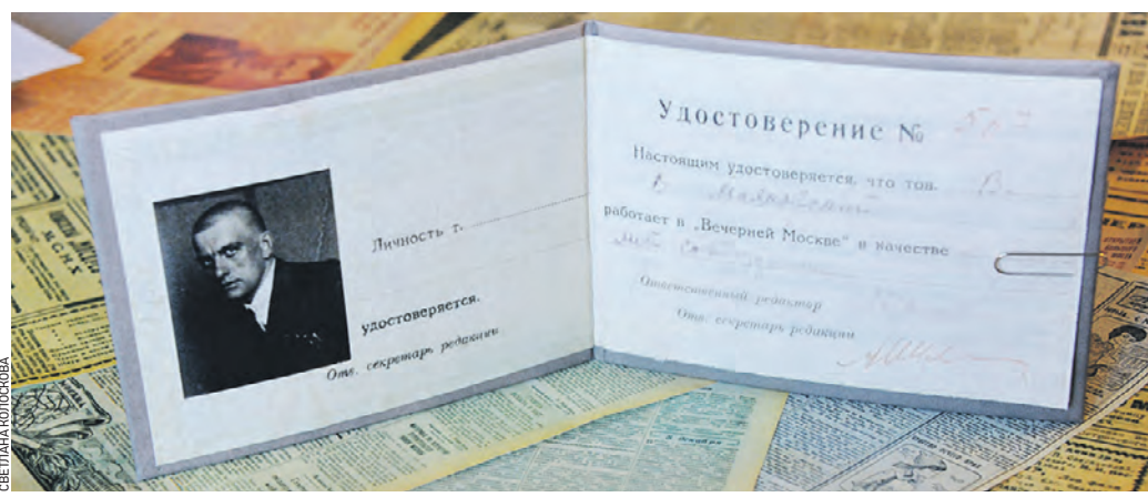
Вчера 12:42 Удостоверение сотрудника «Вечерней Москвы», выданное поэту Владимиру Маяковскому

Одним из первых и, наверное, самых значимых экспонатов нашего музея считается удостоверение литературного сотрудника «Вечерней Москвы», выданное поэту Владимиру Маяковскому. Известно драматургу можно по праву считать большим другом газеты.