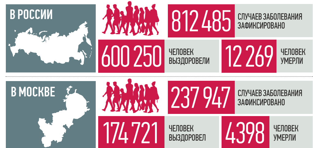
По данным стопкоронавирус.рф и mos.ru на 19:00 26 июля