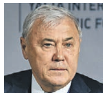
АНАТОЛИЙ АКСАКОВ ДЕПУТАТ ГОСУДАРСТВЕННОЙ ДУМЫ РФ

Отношусь к этой идее положительно. Она идет в ногу со временем, ведь у многих зарубежных компаний существуют такого рода механизмы. Для работы с международными контрагентами это может стать актуальным инструментом. И тут я не вижу каких-либо сложностей или препятствий. Что касается внутреннего оборота, то да, криптовалюта у нас не считается средством платежа, поэтому на отечественном рынке с ней будет сложно. Но это может сработать на перспективу, и когда-нибудь благодаря идее сырьевой отрасли мы к этому придем и в России, будем двигаться в ногу со всем остальным миром. В целом идея может сказаться только с точки зрения пользы. Нововведение станет современным видом фандрайзинга — сбора средств на реализацию тех или иных проектов компаний. Думаю, что это нормальный шаг. Предприятия должны находиться в рамках финансовых отношений, в которых уже присутствуют их ближайшие конкуренты из других стран. Сейчас мы садимся на удобный поезд и комфортно себя чувствуем. А в дальнейшем нужно изучать и накапливать опыт, ведь даже сейчас это вопрос неоднозначный.