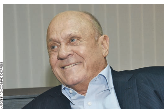
13 сентября 2016 года. Режиссер Владимир Меньшов в кинотеатре «Октябрь» на презентации киноальманаха

(1967), а также у советско-японского фильма «Дерсу Узала» Акиры Куросавы (1975). Что касается непосредственно российского кино, то на настоящий момент единственный «Оскар» как у иностранного фильма есть у ленты «Утомленные солнцем» (1994) режиссера Никиты Михалкова, который также состоит в оscarовском комитете нашей страны. В шаге от победы практически за 30 лет в России были шесть кинофильмов. Номинантами на «Оскар» становились ленты: «Урга: Территория любви» Никиты Михалкова (1991), «Кавказский пленник» Сергея Бодрова-старшего (1996), «Вор» Павла Чухрая (1997), «12» Никиты Михалкова (2007), «Левиафан» (2014) и «Нелюбовь» (2017) Андрея