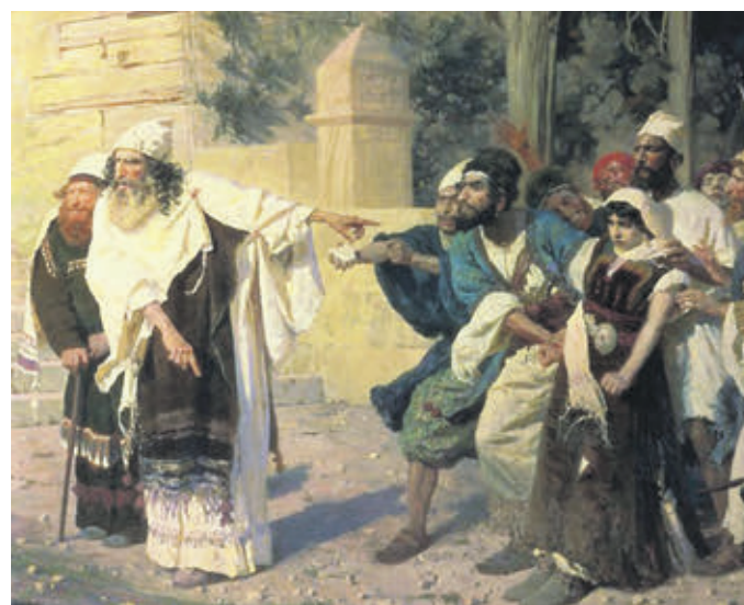
1887 год. Фрагмент картины Василия Поленова «Христос и грешница» («Кто из вас без греха?»)

Сегодня в Государственной Третьяковской галерее представили главный выставочный проект очередного сезона — масштабную ретроспективу творчества Василия Поленова. Легендарный «Московский дворик» и другие полотна выдающегося пейзажиста можно увидеть до середины февраля в Новой Третьяковке на Крымском Валу.