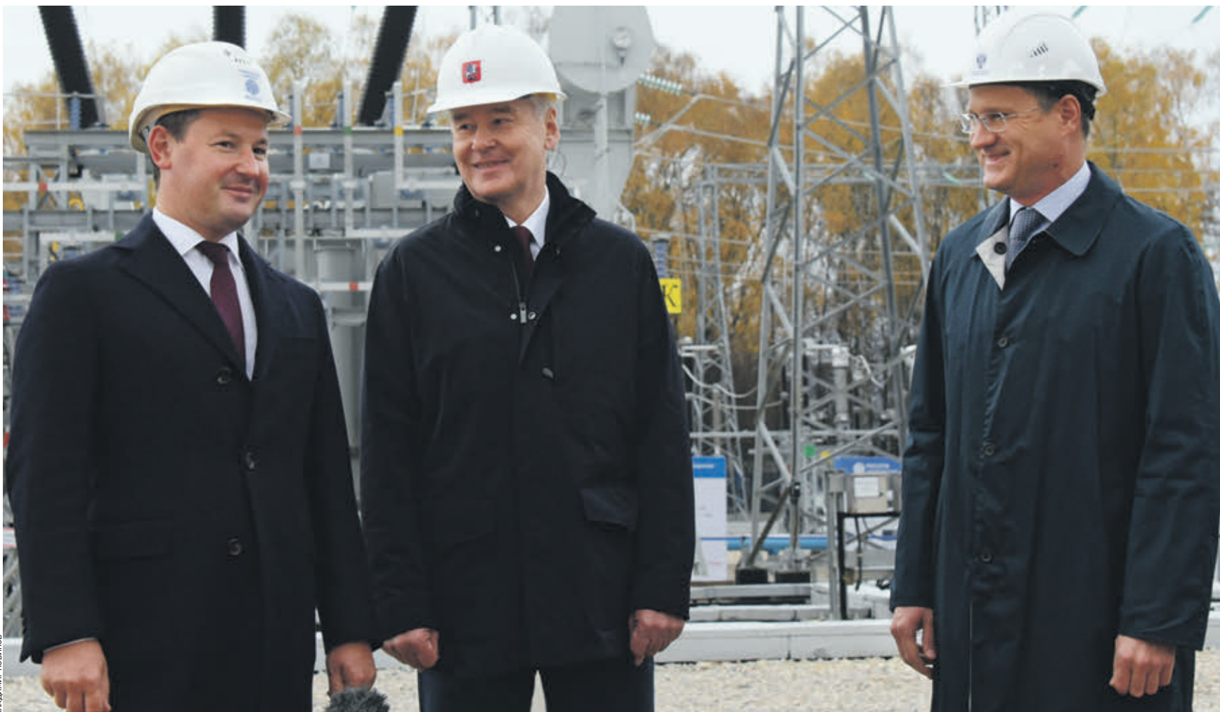
Вчера 16:19 Слева направо: генеральный директор ПАО «Россети» Павел Ливинский, мэр Москвы Сергей Собянин и министр энергетики России Александр Новак на открытии электроподстанции «Хованская»

Очень важно обеспечить надежное и качественное энергоснабжение потребителей, — согласился с мэром министр