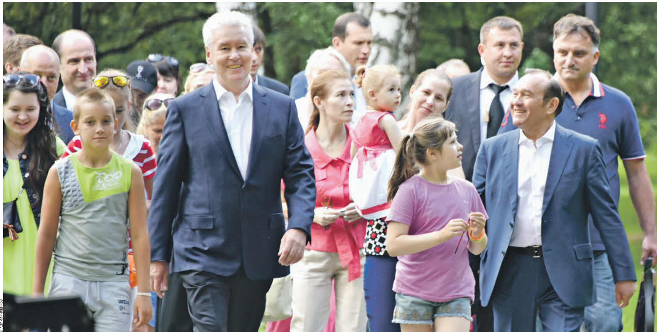
6 августа 2015 года. Мэр Москвы Сергей Собянин (в центре) вместе с горожанами осмотрели народный парк «Соловьиная роща». Показывал благоустройство замэра Москвы Петр Бириюков (справа)

Команда Сергея Собянина реализует в столице крупнейшие программы. Среди них — реновация и модернизация здравоохранения