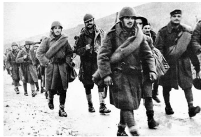
Фотография с выставки «Дни Охи» в Музее Москвы. Изображение солдат греческого сопротивления

Открытие экспозиции приурочено к национальному греческому празднику «День Охи», который также называют «Годовщина «нет»». Праздник отмечают в память о 28 октября 1940 года, когда греческий премьер-министр Иоаннис Метаксас отказал итальянским войскам в праве войти на территорию страны. Именно этот день считается датой вступления Греции во Вторую мировую войну. — Бенито Муссолини, лидер итальянских фашистов того времени, ориентировался на Адольфа Гитлера, — говорит историк Александр Курчатов. — Видя, как тот успешно колесит по Европе и одерживает