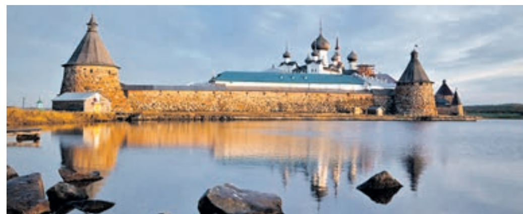
Вчера 19:00 Одним из экспонатов выставки — чудеса России — стала фотография Соловецкого монастыря