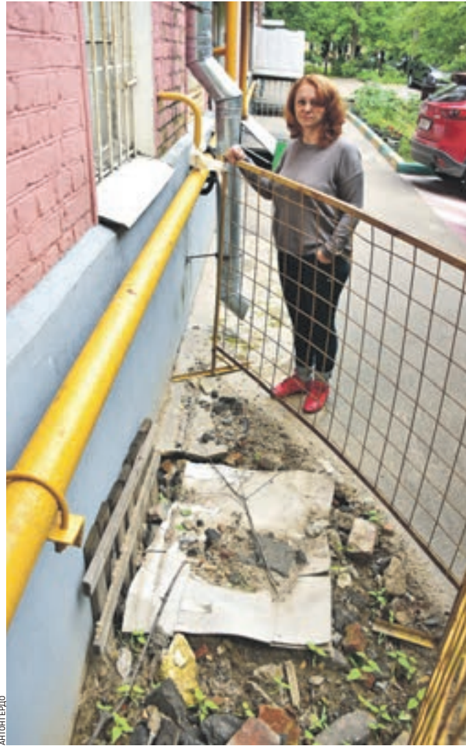
Вчера 09:00 Жительница дома 23а по шоссе Энтузиастов Тамара Бондарь показывает яму под окном