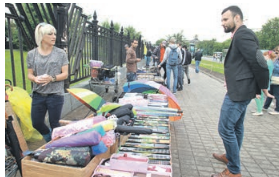
Вчера 12:45 Аллея около Мемориального музея космонавтики. Проходное место превратилось в островок «лихих девяностых» — почти на всем протяжении улицы расположились нелегальные торговцы, промышляющие всем — от клеенок до сомнительного качества сувениров

ОБО ВСЕХ НАРУШЕНИЯХ МОЖНО НАПИСАТЬ НА ПОРТАЛ «НАШ ГОРОД»: GOROD.MOS.RU