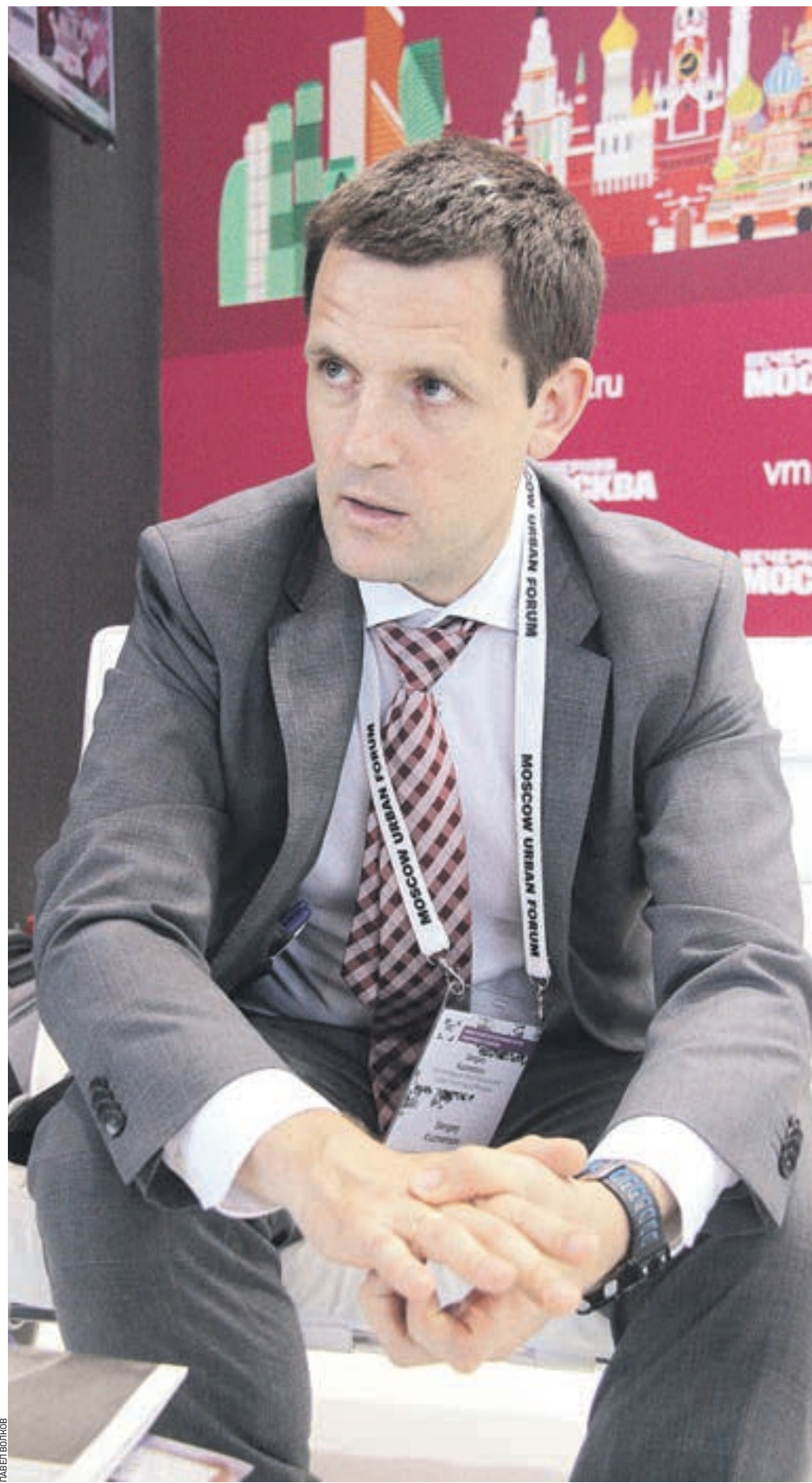
6 июля 2017 года 14:33 Главный архитектор Москвы Сергей Кузнецов во время интервью на стенде «Вечерней Москвы», организованном на время седьмого Московского урбанистического форума