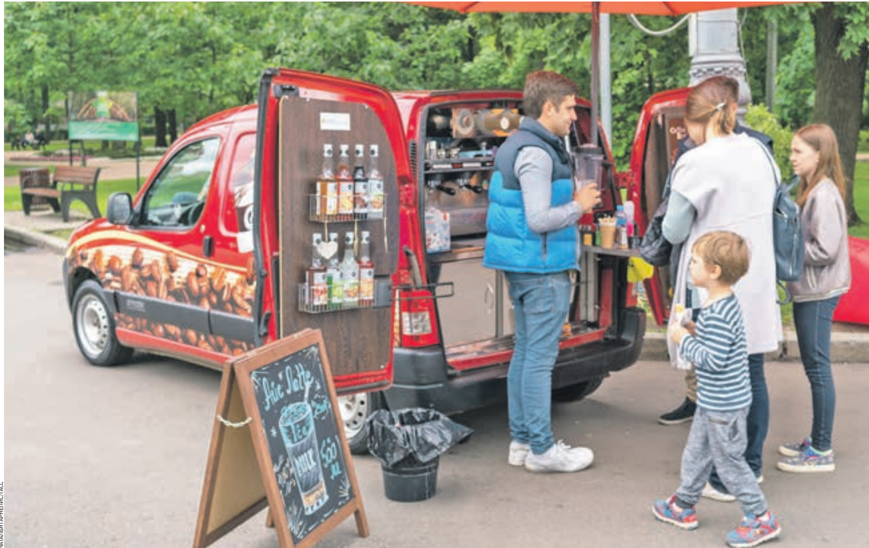
24 июня 2017 года 14:59 В парке «Сокольники» проходит очередной ежегодный Фестиваль фудтраков. Фишка нынешнего лета — мобильные рестораны на колесах

Ну, во-первых, изменилось отношение к фастфуду. Раньше считалось, что это что-то третьесортное и страшно вредное. Но сейчас, благодаря всем этим фестивалям и праздникам, стало понятно, что фастфуд — это то, что выдано и продано быстро, но отнюдь не моментально приоткрыто. За рубежом это сейчас один из главных трендов — еда ресторанного качества, которая быстро выдается на руки. Типичный представитель — Chipotle Mexican Grill, мировая сеть демократичных ресторанов мексиканской кухни, причем