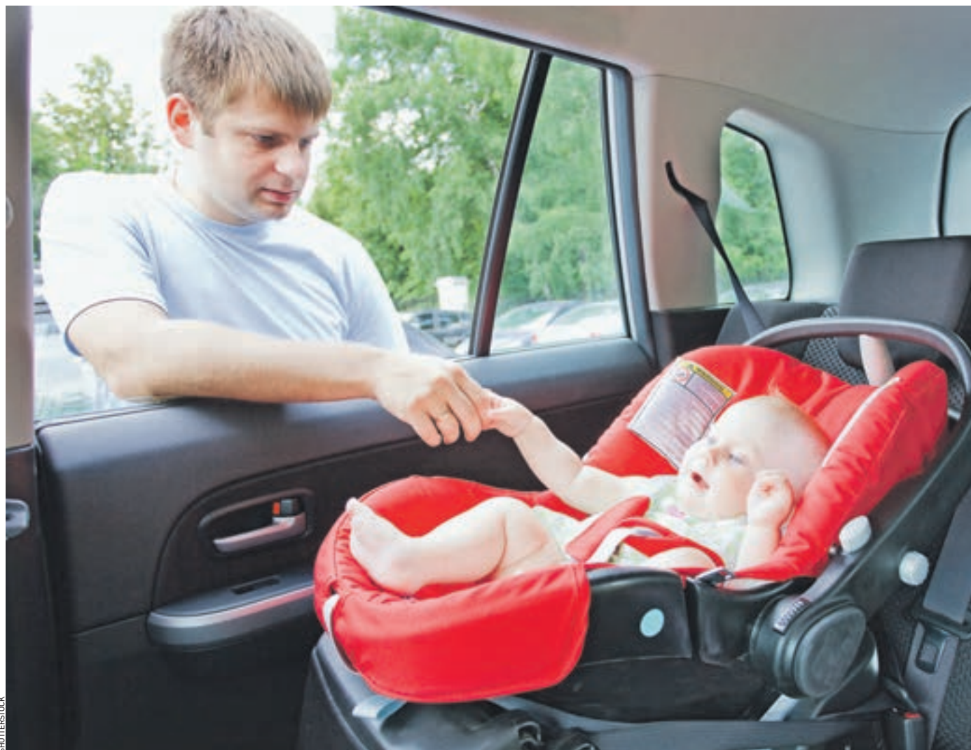
7 июля 2017 года 15:00 Москвич посадил сынишку в автомобиль. По правилам, если ребенок еще не может сидеть, его разрешается размещать на заднем сиденье в специальной люльке, вынимаемой из коляски

— Дети сейчас все чаще высокие и крупные, они просто физически не помещаются в детском кресле, — пояснил экс-