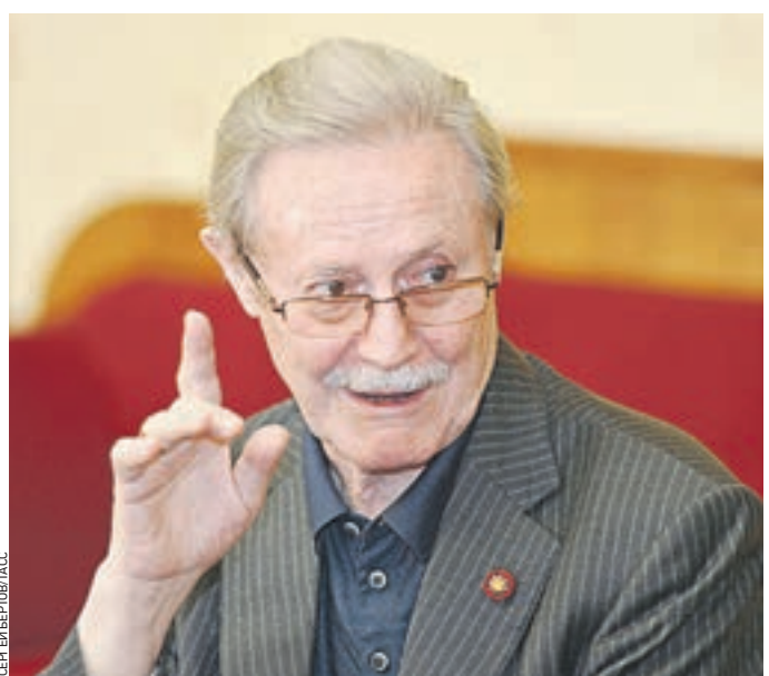
31 мая 2016 года. Юрий Соломин всегда открыт для общения

Художественный руководитель Государственного академического Малого театра России Юрий Соломин перед премьерой документального фильма «Его Величество Актер» о его жизни и деятельности в легендарном театре вспомнил главные моменты своего пути и дал советы подрастающей смене.