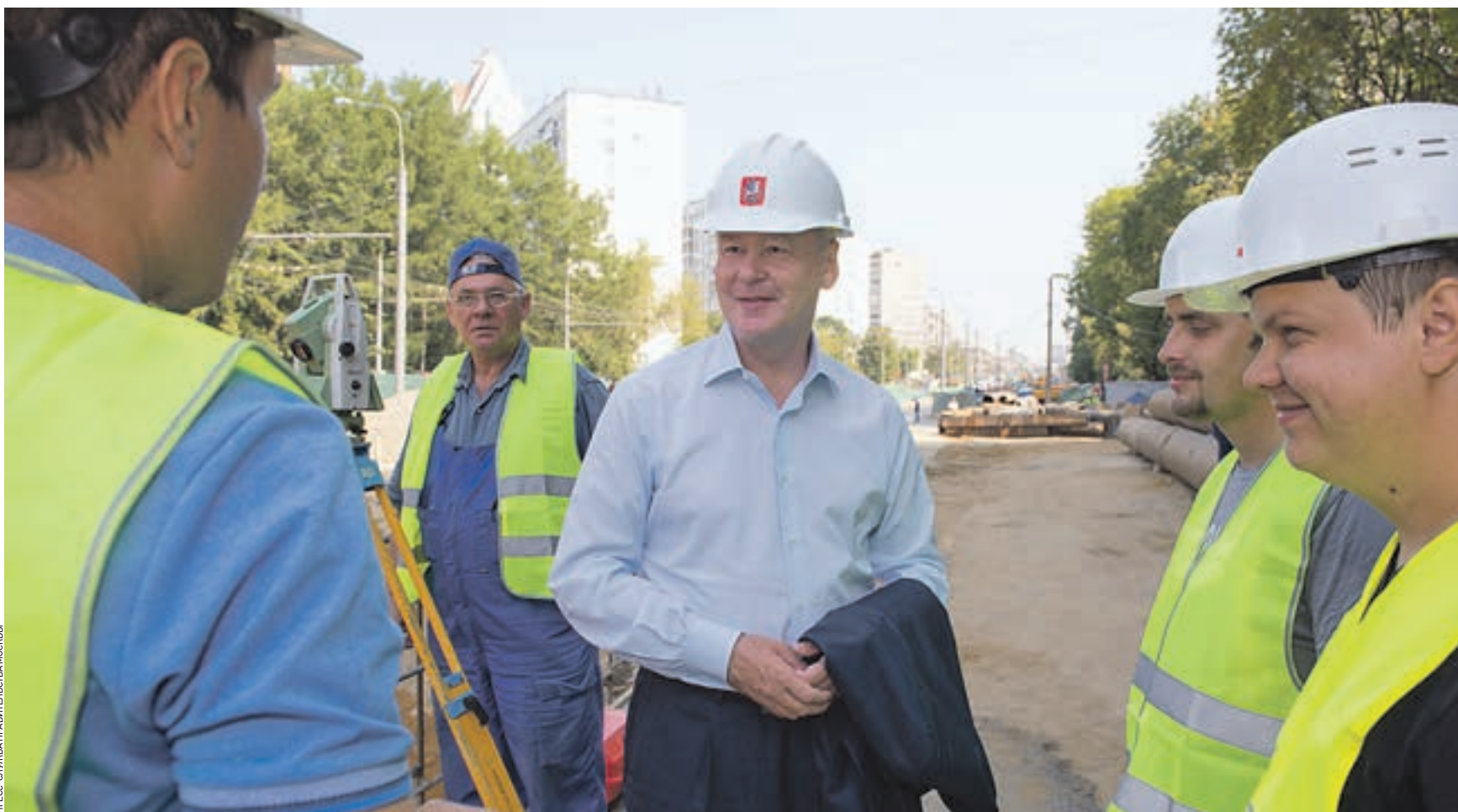
Вчера 11:07 Мэр Москвы Сергей Собянин (в центре) общается со строителями и геодезистами, которые возводят первый в столице винчестерский тоннель...