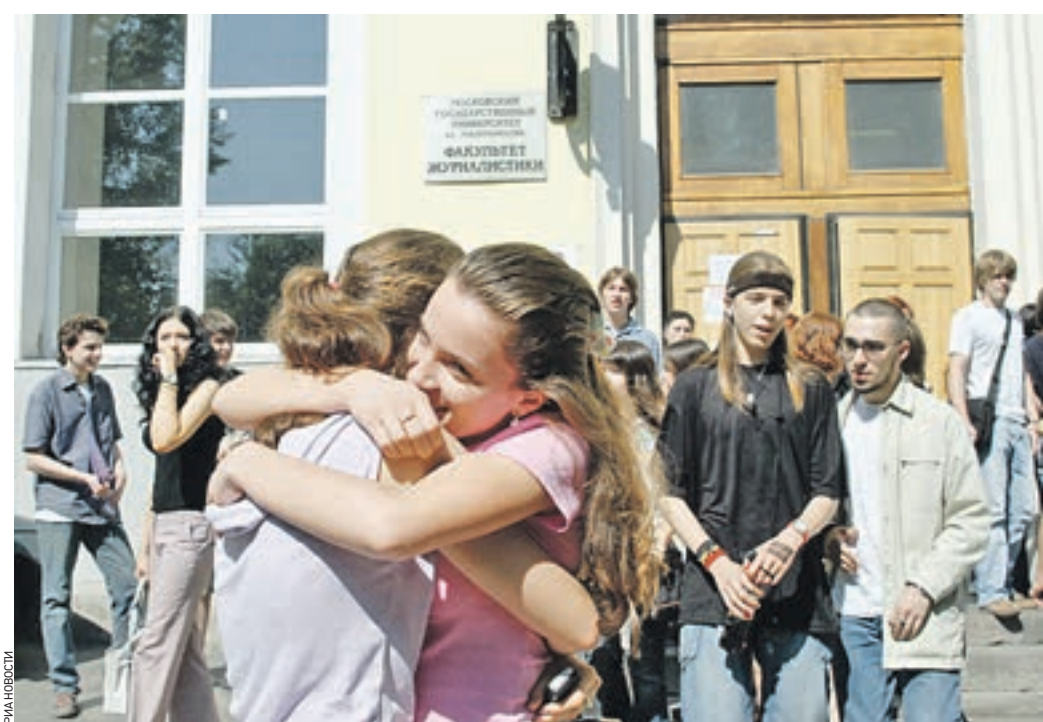
14 июля 2013 года. Абитуриенты факультета журналистики МГУ только что увидели свои фамилии в списках зачисленных

СТР. 1 → В Московском городском педагогическом университете целевиков предпочитают принимать только в магистратуру. — Предприятия направляют к нам сотрудников, потому что педагогическое образование сейчас ценится во многих видах деятельности — кадровая работа, консалтинг, торговля, — рассказывает ректор Московского городского педагогического университета Игорь Реморенко. — Конкурс к нам вырос в полтора раза. Самые популярные специальности в педагогическом университете — учитель начальных классов со знанием иностранного языка, специалист в сфере образовательного права, а также лингвист со знанием восточных языков. В этом году при зачислении учитывались баллы за сочинения, которые писали школьники в декабре, а также «индивидуальные достижения учащихся» — портфолио, спортивные награды, победы на олимпиадах. Все эти успехи могли добавить в общей сложности не больше 20 баллов. Причем, например, победитель олимпиады должен был набрать не меньше 65 баллов по профильному предмету. И удалась это далеко не всем. Сколько очков добавлять за достижение, каждый вуз решал сам. В случае с сочинени-