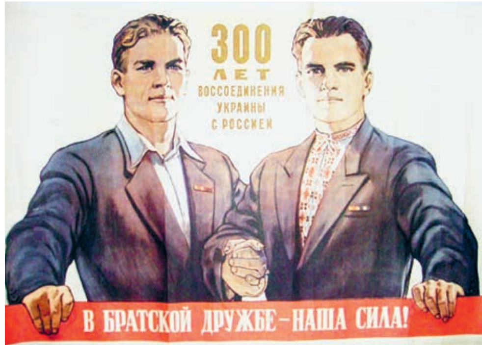
Были когда-то и такие плакаты...

Во всем мире политические ссоры в первую очередь вредят экономике. Например, в Евросоюзе процесс выхода Великобритании тянется уже третий год из-за высокой цены, назначенной Европой за «развод» – 60 млрд евро. На уступки не хочет идти никто, ибо это реальная сумма ожидаемых потерь. «В случае отказа Великобритании выплатить указанную сумму разницу придется покрывать гражданам других стран ЕС», – прямо заявляет председатель Европарламента Антонио Таяния.