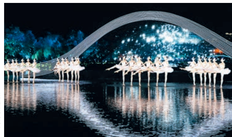
4 сентября 2016 года во время саммита «Группы двадцати» в Ханчжоу лидеры стран G20 посетили концерт у озера Сиху.