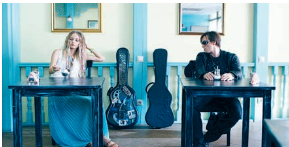
Авторы фильма поместили в «Заповедник» не журналиста, а музыканта с гитарой.

Режиссер и сценарист Анна Матисон (а по совместительству, да-да, молодая жена Сергея Безрукова) сюжетный каркас повести Довлатова сохранила. Как и часть его блестящих, остроумных диалогов, которые украшают фильм. Но в соответствии с новой профессией главного героя и новым хобби своего мужа, который в последнее время полюбил петь,