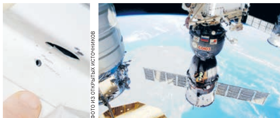
Не велика дыра, а столько тревог и хлопот создала.