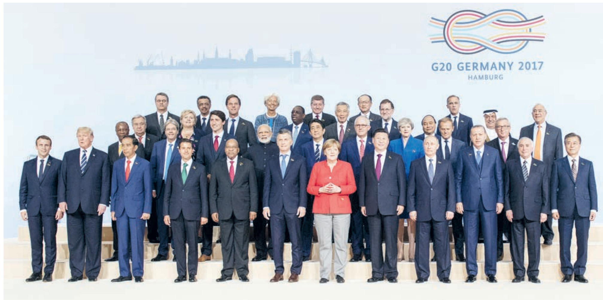
7 июля 2017 года в немецком Гамбурге состоялся 12-й саммит G20.

Кроме того, китайская инициатива «Пояс и путь», основывающаяся на принципах «совместных консультаций, совместного строительства и совместного использования», сама по себе показывает приверженность КНР мультилатерализму, а также стремление к укреплению международного сотрудничества, стимулированию упрощения торговли и совершенствованию глобального управления.