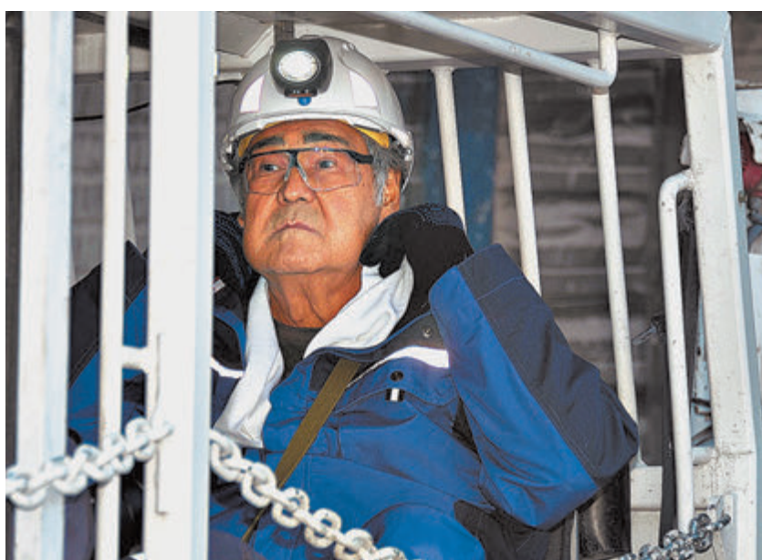
Политический тяжеловес Аман Тулеев.

Опасная принципиальность, этак можно доорассуждаться и до более высоких материй! Пока же инициаторы поправки объясняют свою озабоченность по-житейски просто: когда губернатор долго засиживается на посту, он теряет чувство реальности и попадает во