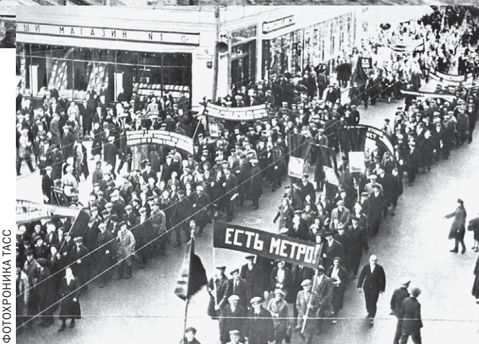
Демонстрация строителей, посвященная пуску первой линии Московского метрополитена, 1935 год.

я сразу отметила про себя: с таким животом надо бы дома сидеть, у телефона. Только подумала, как у нее схватки начались. Муж в панике. Пассажиры помогли мне вынести даму из вагона, освободили место на скамеечке. Спрашиваю: потерпишь, пока мы тебя на эскалаторе на свет поднимем, или тут родишь? Потерпела. Родила девочку уже в скорой. Муж потом сокрушался: эх, надо было родить на станции метро, глядишь, дочке проездной до конца жизни выдали бы... А я ему: тогда уж до самолета терпели бы, прямая выгода. Между прочим, недавно вычитала такую цифру: в войну, когда метро стало бомбоубежищем для тысяч москвичей, в нем родились 217 детишек. Уже за одно это нашей подземке надо памятник поставить!