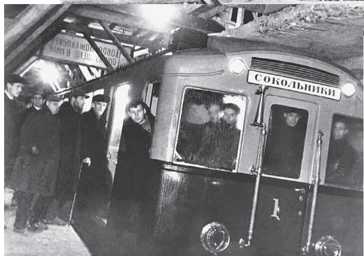
Первый испытательный поезд, совершивший пробную поездку от станции «Комсомольская» до станции «Сокольники».

Строительство московского метро, 1933 год.