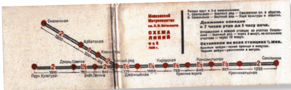
Схема московского метро, 1935–1936 годы.