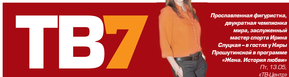
Прославленная фигуристка, двукратная чемпионка мира, заслуженный мастер спорта Ирина Слуцкая – в гостях у Ирины Прошутинской в программе «Жена. История любви» Пт, 13.05, «ТВ-Центр»