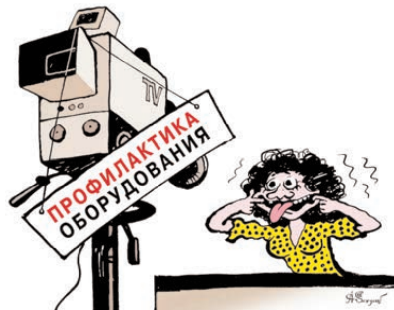
ИЛЛЮСТРАЦИЯ АЛЕКСАНДРА СЕРГЕЕВА / CARTOONBANK.RU

Есть три следующих непреложных факта. Первый: узнавать новости россияне предпочитают по телевидению, и никакие другие СМИ конкурировать с ним не в состоянии. Второй: с июля по сентябрь практически все знаковые общественно-политические программы и ток-шоу, которые дают зрителю возможность относиться к этим самым новостям правильно, уходят в отпуск. И третий: почему-то именно в августе в нашей стране случаются всякие неприятности и катаклизмы. Суммировав, мы получаем тревожную картину: в самые драматические моменты электорат остается предоставленным самому себе. Никто ему ничего не объясняет и не растолковывает – что хочешь, то и думай.