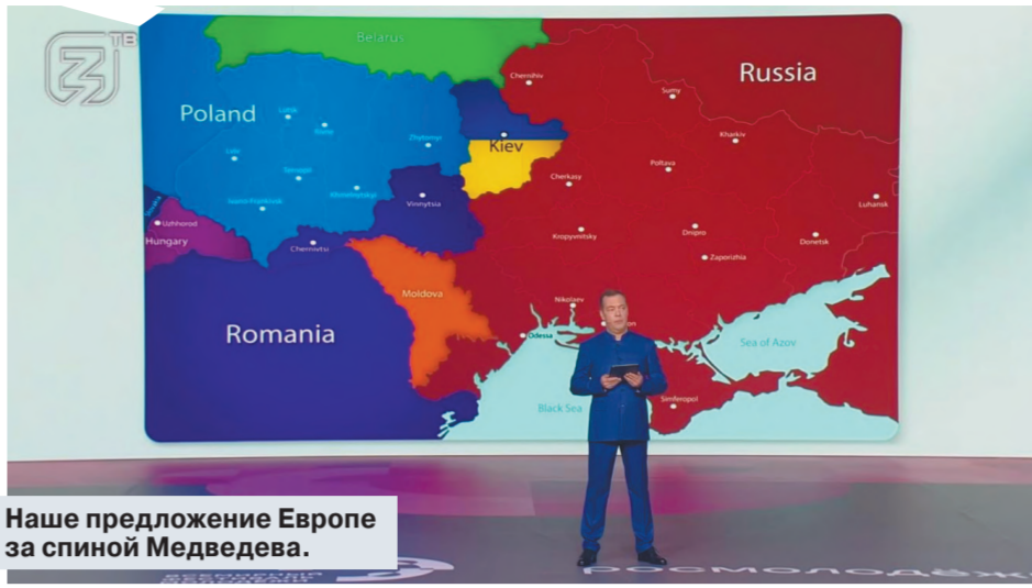
Наше предложение Европе за спиной Медведева.