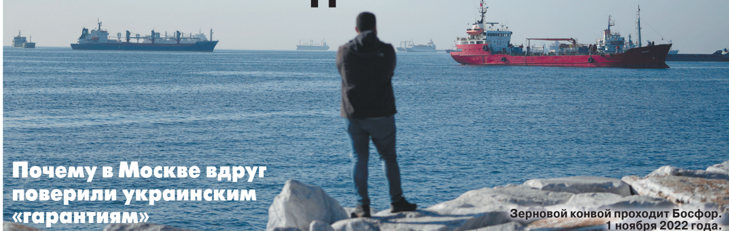
Зерновой конвоем проходит Босфор. 1 ноября 2022 года.

Почему в Москве вдруг поверили украинским «гарантиям»