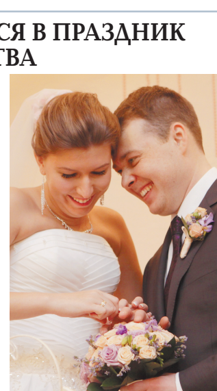
офисах ЗАГС в центрах госуслуг «Мои документы» в любой день, кроме 4 ноября.

№1 и №4, с 4 по 7 ноября — выходные дни. С 8 ноября столичные загсы будут работать в обычном режиме. Дворцы бракосочетания №1 и №4 в предпраздничный день, 3 ноября, будут открыты до 17.00. 4 ноября — праздничный выходной день. С 5 ноября дворцы начинают работу в обычном режиме. Архивно-информационный отдел и Замоскворецкий отдел ЗАГС с 4 по 6 ноября работать не будут. В обычном режиме учреждения готовы к приему посетителей с 7 ноября. Узкоспециализированные услуги ЗАГС можно будет получить в 11