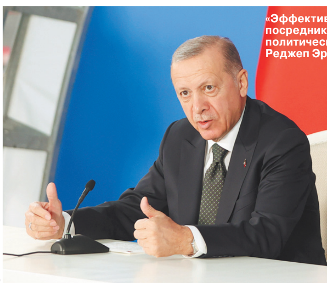
«Эффективный посредник» или великий политический решала Реджеп Эрдоган.