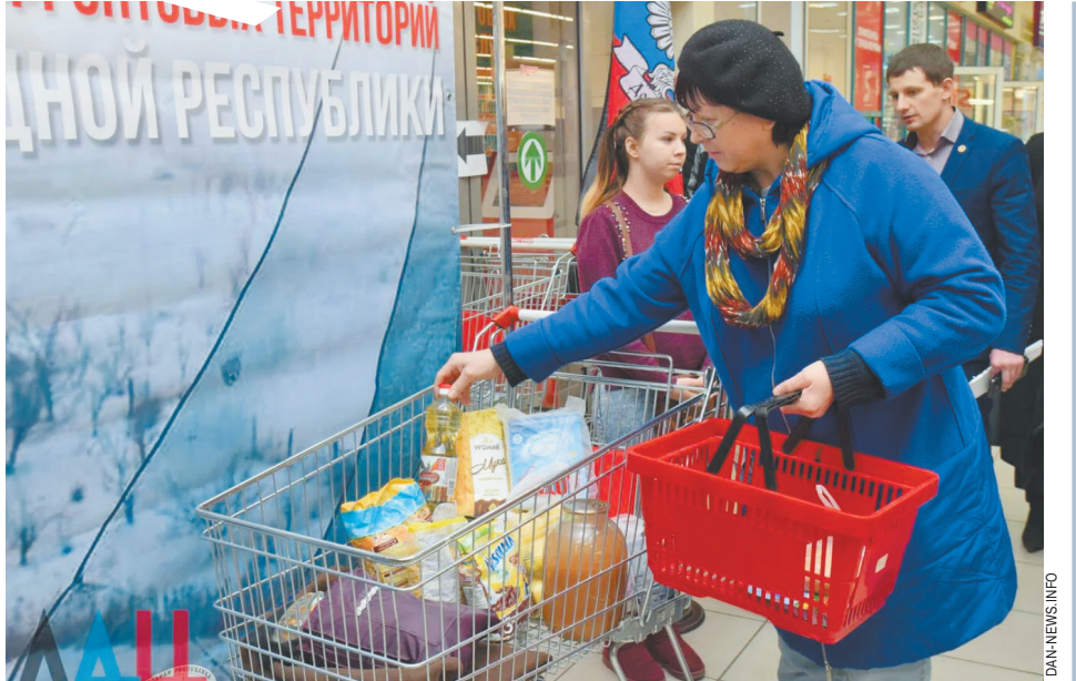
столбе часто бывает фаршированный перец с овощами...

В Донецке не понимают, отчего в Москве периодически возникает ажиотаж вокруг продуктов: то гречки, то сахара, то чеснока... Даже в ДНР, прошедшей огонь и воду, по большому счету продовольственного дефицита не было. Тем не менее местные жители советуют делать запасы, но не большие, в разумных пределах.