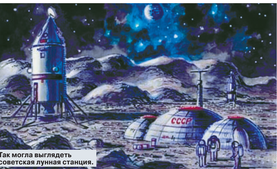
Так могла выглядеть советская лунная станция.

Дальше — больше: с 1980 года база «Колумб-2» должна была перейти на длительное существование с увеличением штата до 10 человек и сменой персонала раз в год. Инженеры института обращали внимание,