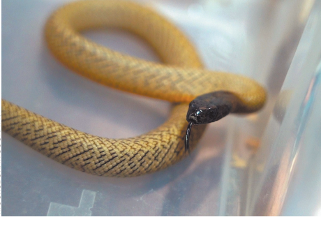
Жилище имитирует песчано-глиняную пустыню, характерную для внутренней части Австралии, где нет лесов и гор, лишь песчаный грунт и укрытия. Несмотря на ядовитость, материковый тайпан не очень агрессивен. Все задокументированные случаи укусов были следствием неосторожного обращения с ними со стороны человека. В среднем от одной змеи можно получить 44 мг яда — этого достаточно, чтобы убить более 100 человек.

контейнеры. Это делается для того, чтобы исключить вероятность нападения друг на друга и снизить уровень стресса. Специалисты следят за развитием малышей и их здоровьем. Первое время им не клали грунт, так как он может попасть в корм и навредить. Очень важно поддерживать повышенную влажность 80–90%, чтобы детеныши полноценно перелиняли. В случае частичной линьки фрагменты чешуи могут остаться на глазах и привести к потере зрения. Когда змеям исполнится полгода и они достигнут 50–60-сантиметровой длины, их переселят во взрослые террариумы.