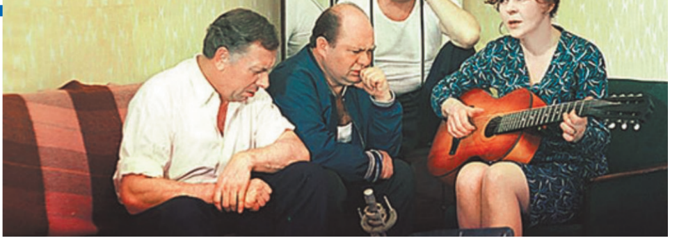
Кадр из фильма «Белорусский вокзал».