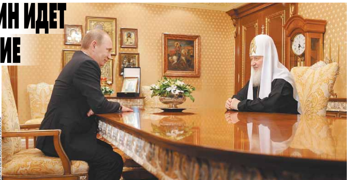
Упоминание о Боге в тексте Основного закона обречено взбесить атеистов и сторонников максимально возможного отделения государства от церкви.

Обычно в случае принятия новой Конституции или кардинальной ревизии старого Основного закона принято говорить, что получивший документ — «это на века».