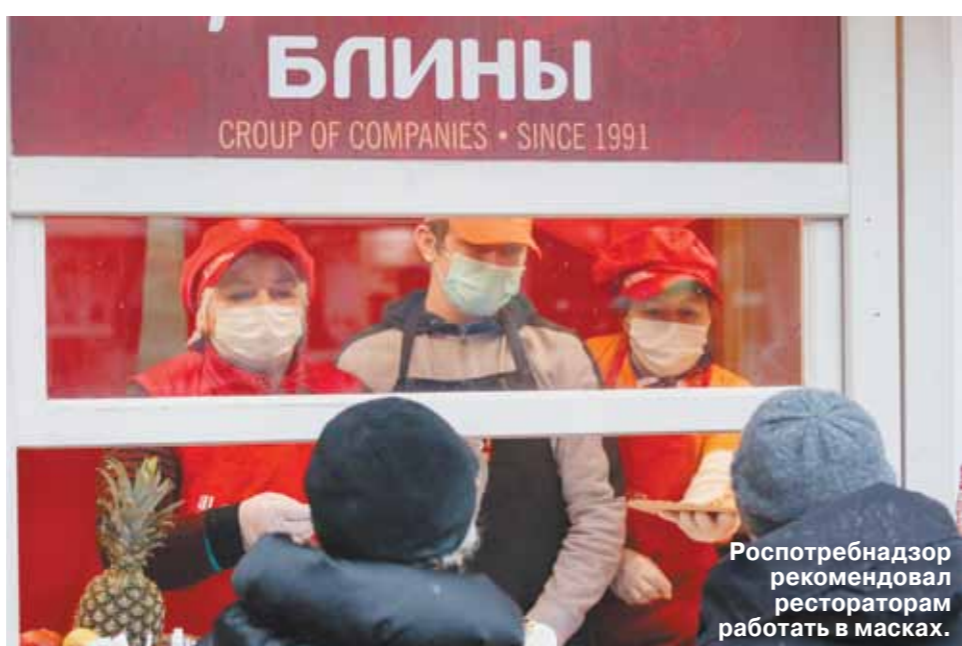
Роспотребнадзор рекомендовал рестораторам работать в масках.