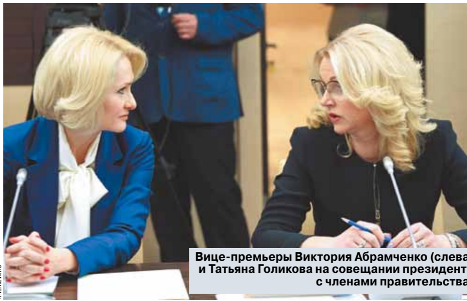
Вице-премьеры Виктория Абрамченко (слева) и Татьяна Голикова на совещании президента с членами правительства.

У России нет проблем с коронавирусом, но есть проблемы с масками и фейк-ньюс. На совещании с членами правительства Владимир Путин усомнился в целесообразности поставок медицинских масок за рубеж даже в гуманитарных целях.