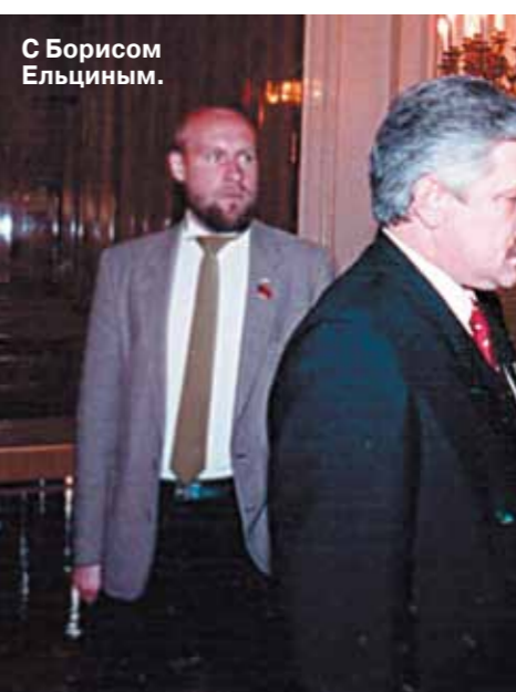
С Борисом Ельциным.

— Я проважал Ельцину в Минск. Он мне сказал, что летит подписывать с Белоруссией соглашение об экономическом сотрудничестве. А утром я, как и народ всей страны, узнал, что СССР упразднен и создается СНГ. По прилету Ельцина я все ему высказал, что думаю по этому поводу.