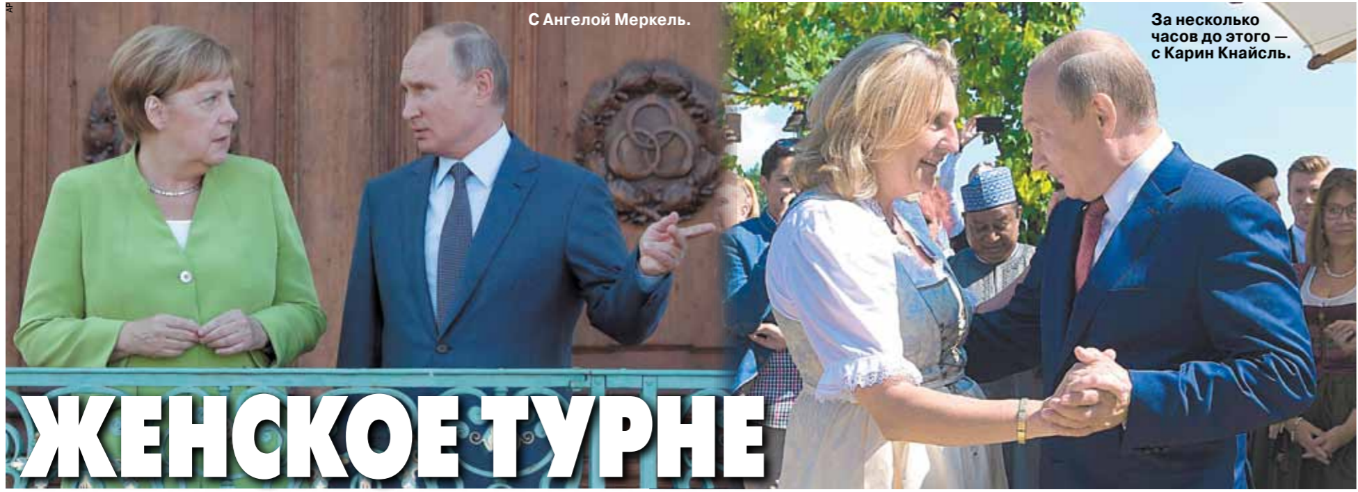
С Ангелой Меркель.