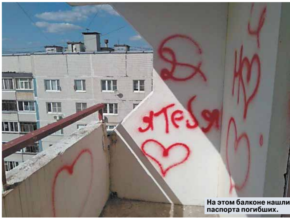
На этом балконе нашли паспорта погибших.

— С 14 лет примерно. — Может, ударялись где-то? — Скорее, меня ударяли... Он (Мария отца