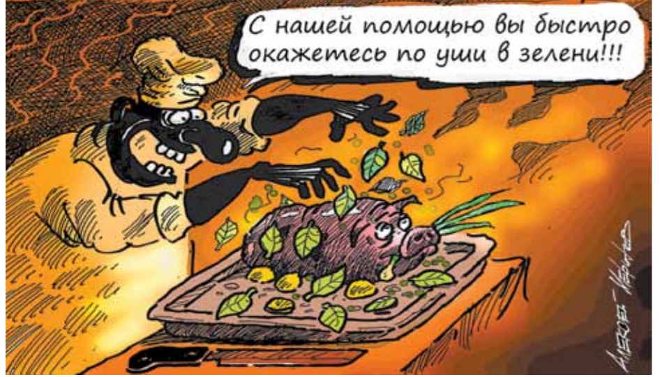
С нашей помощью вы быстро окажетесь по уши в зелени!!!

Финансовые организации намеренно вводят в заблуждение своих клиентов Остерегайтесь мошенников! Такое предупреждение мы слышим буквально из каждого утюга. Прежде всего главным поборниками честности выступают банки. Однако сами кредитные организации не прочь похититься за счет финансовой неграмотности своих клиентов. Они буквально впаривают гражданам рискованные продукты и услуги, утаивая от них всю необходимую информацию. Причем речь идет не только о ставках уже привычными навязываемых страховок и акций компаний, доходность по которым впоследствии не соответствует ожиданиям клиента. Читайте 4-ю стр.