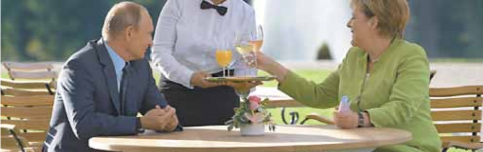
В РОСКОШНОМ «ГОСТЕВОМ ДОМЕ» НА БЕРЕГУ ОЗЕРА ГУВЕНОВЗЕЕ