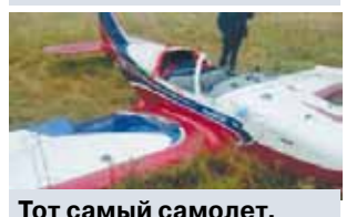
Тот самый самолет.

Ошибка летного инструктора, возможно, послужила причиной вынужденной аварийной посадки легкомоторного самолета Piperlet 330. Летательный аппарат зацепился крылом за провода в деревне Мышкино Можайского района Московской области в воскресенье около часа дня. Как сообщили «МК» в правоохранительных органах, при совершении маневра самолет задел ЛЭП, повредил кабину и совершил вынужденную посадку в поле. После касания на подстанции сработала защитная автоматика, которая перевела деревню на резервный источник питания, то есть местные жители не