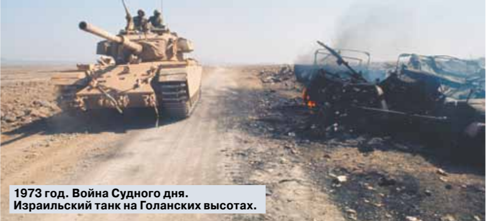
1973 год. Война Судного дня. Израильский танк на Голанских высотах.