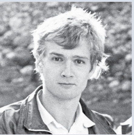
Дмитрий Холодов работал в военном отделе газеты «Московский комсомолец». Побывал во многих «горячих точках» — в Абхазии, Чечне, Азербайджане, на таджикско-афганской границе. Стал известным благодаря своим публикациям о коррупции в Российской армии. В своих материалах неоднократно подвергал критике министра обороны

В связи с этим Центр содействия международной защите решил принять меры, побуждающие государство выполнять международные обязательства. В МИД РФ было направлено обращение, в котором говорилось о том, что исполнение Россией решений, принимаемых Комитетом ООН, является обязательным. Это следует из статьи 26 Венской Конвенции о праве международных договоров, ратифицированной еще СССР, чьи прежнееком объявила себя Россия. В силу этого договора Россия обязана обеспечить каждому лицу, чьи права и свободы, гарантированные Пактом, были нарушены, эффективное средство правовой защиты, как это закреплено в параграфе 3 статьи 2 Пакта. При этом исключается необходимость создания каких-либо дополнительных документов. Кроме того, Россия ратифицировала и Факультативный протокол №1 к Международному пакту о гражданских и политических правах. В силу этого протокола государство-участник признает компетенцию Комитета по правам человека ООН принимать и рассматривать обращения подлежащих его юрисдикции лиц на предполагаемые нарушения государствами-участниками протокола их прав и свобод. В связи с этим Центр международной защиты призвал Россию исполнить решение Комитета ООН и просил Министерство иностранных дел уведомить правозащитников о намерениях в отношении решения комитета по рассматриваемому делу.