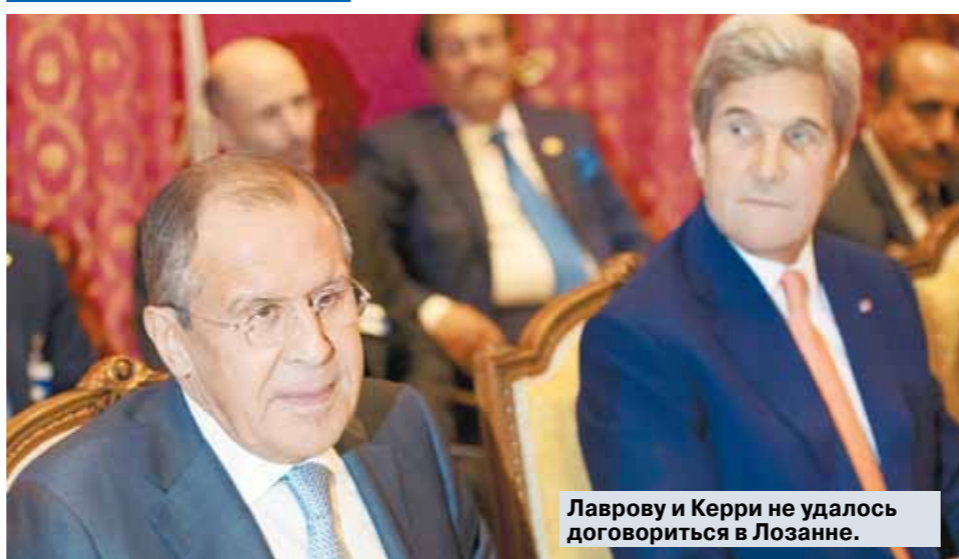
Лаврову и Керри не удалось договориться в Лозанне.