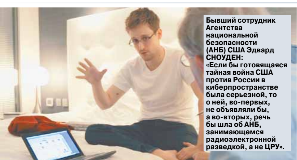
Бывший сотрудник Агентства национальной безопасности (АНБ) США Эдвард СНОУДЕН: «Если бы готовящаяся тайная война США против России в киберпространстве была серьезной, то о ней, во-первых, не объявляли бы, а во-вторых, речь бы шла об АНБ, занимающемся радиоэлектронной разведкой, а не ЦРУ».

Дипломаты сидели за переговорным столом в течение примерно четырех часов. Российская сторона настаивает на том, что залогом восстановления и успешной реализации режима прекращения огня в Сирии, обеспечения гуманитарного доступа ко всем нуждающимся является отграничение отрядов «умеренной» оппозиции от