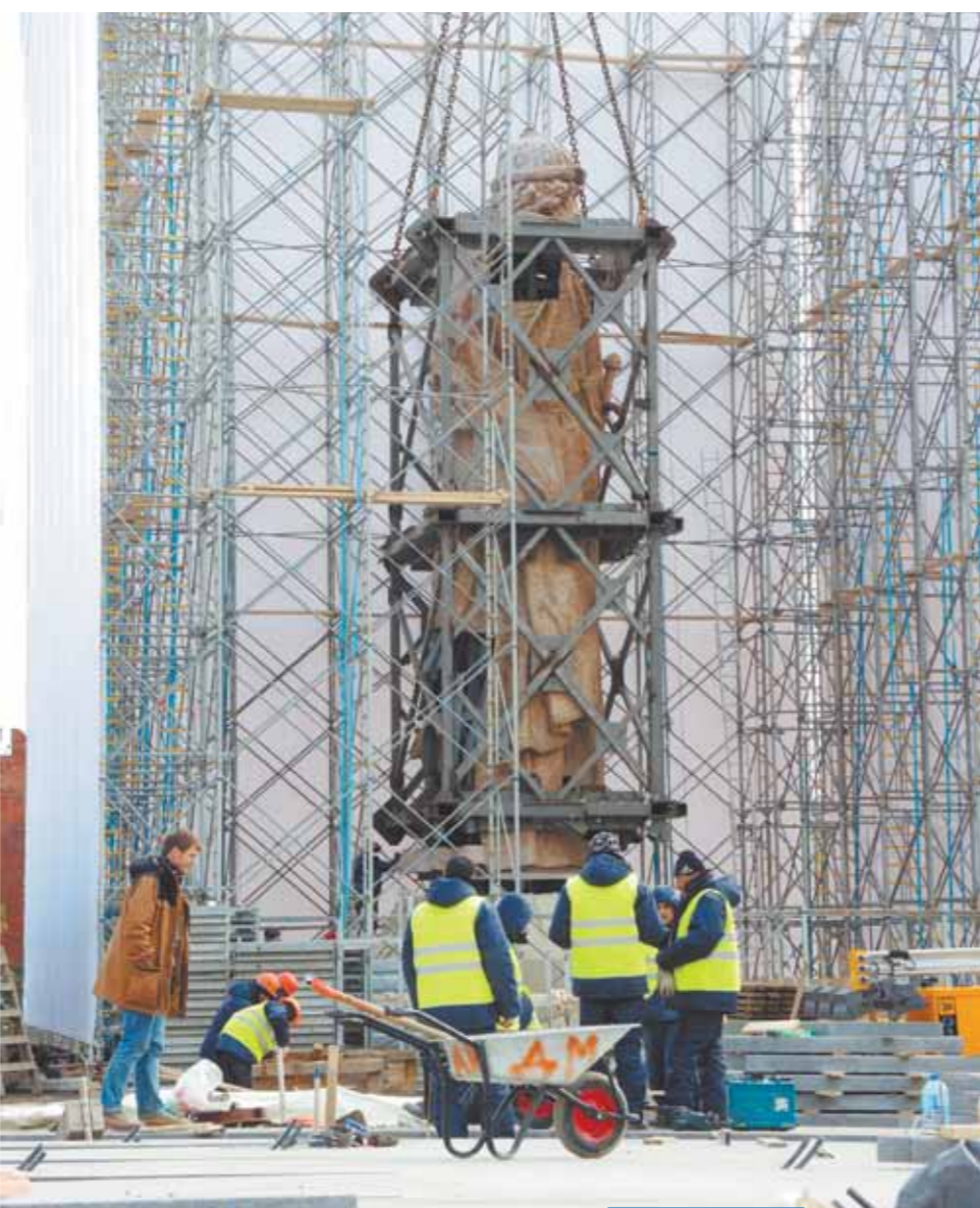
ФОТОРЕПОРТАЖ на сайте mk.ru