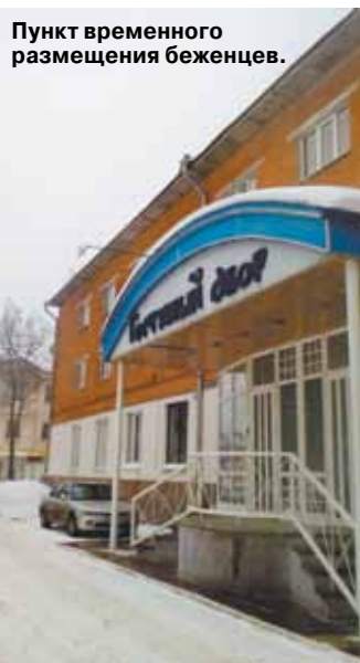
Пункт временного размещения беженцев.

Переселенцев с Донбасса выгоняют на улицу — деньги на их содержание закончились