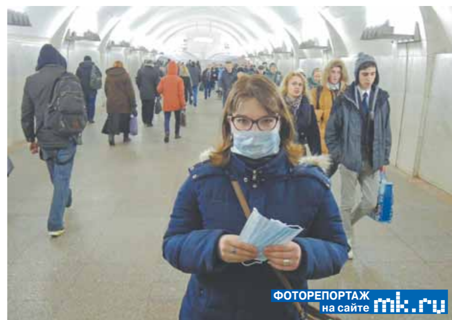
ФОТОРЕПОРТАЖ на сайте mk.ru