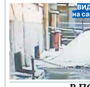
ВИДЕО на сайте mk.ru

Из-за начавшейся в Москве оттепели глыбы льда снова стали падать с крыши на прохожих. Правда, на этот раз ЧП случилось из-за того, что коммунальщики для предотвращения несчастных случаев сами сбросили ком снега на проходившую мимо женщину.