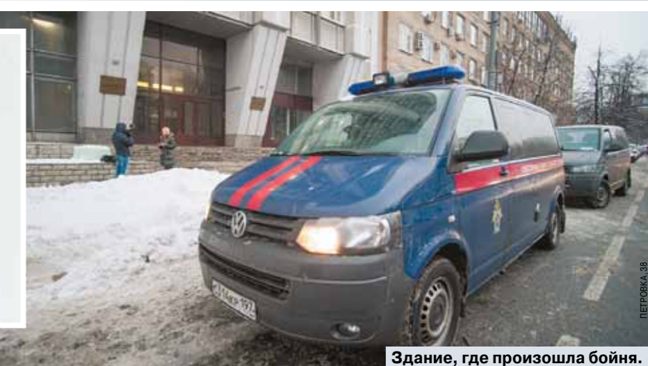
Здание, где произошла бойня.

Интересно, что вахтер на выходе был даже не в курсе инцидента. Ему позвонили с вопросом полицейские и поинтересовались: правда ли, что в здании стреляют? Экстренные службы вызвали шокированные сотрудники компании. Убийца ушел в свою машину «Кадиллак», на которой приехал (причем предварительно