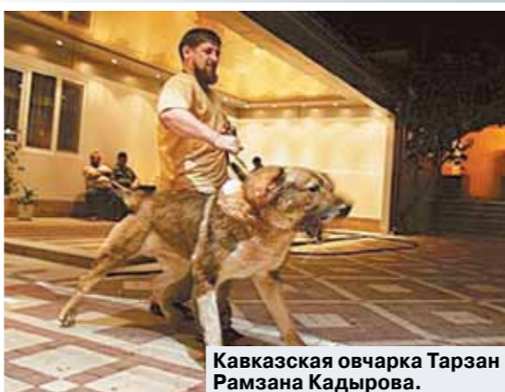
Кавказская овчарка Тарзан Рамзана Кадырова.