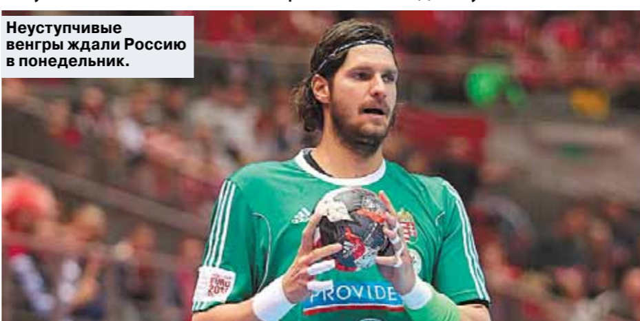
Неуступчивые венгры ждали России в понедельник.

пообщаться всегда готов: — Я бы не стал говорить, если вспоминать игру против Дании, что дело только в том, что нам сил не хватало. Хотя, конечно, у датчан — склейка подлиннее. И они, когда увидели, что у лидеров против нас не получается, не то чтобы верным составом стали играть, но замен сделали немало. А у нас многие даже 5-10 минут отдохнуть не смогли — именно поэтому, уверен, в концовке мячи теряли.