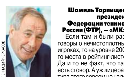
Шамиль Тарпицев, президент Федерации тенниса России (ФТР), — «МК»: «Если там и были разговоры о нечестных игроках, то на уровне 200-го места в рейтинге-листе. Да и то не факт, что там есть сговор. А уж лидером тура этого совсем не надо, потому что они и так хорошо зарабатывают: зачем им провоцировать себя? Кроме слухов — конкретки никакой нет. Можно сколько угодно говорить о фактах сговора, но доказать это в теннисе практически невозможно».

Наберет ли обороты скандал, столь удачно раскрученный к старту турнира Большого шлема? На фоне недавних историй с футболом и легкой атлетикой такой поворот событий уже не кажется фантастическим. Но не стоит забывать, что обе ассоциации, собравшие под своим крылом сильнейших игроков мира, в отличие от тех же ФИФА, ИААФ и ВФЛА, являются коммерческими. Первой в очереди, если следовать логике, придется держать ответ Международной теннисной федерации (ИТФ), а это как раз общественная организация, которая де-юре курирует все 4 турнира Большого шлема, Кубок Дэвиса и Кубок Федерации, а также все олимпийские соревнования в большом теннисе. С этой точки зрения логично: разговоры начались именно сейчас, в канун первого такого мероприятия в Австралии.