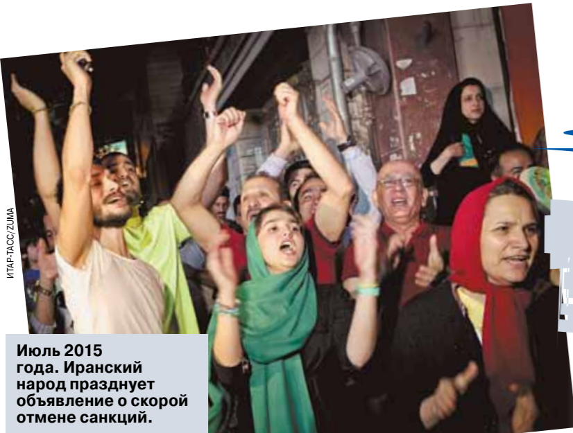
Июль 2015 года. Иранский народ празднует отмену санкций.