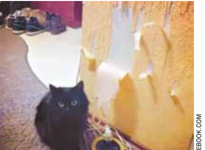
Кошка Илья Яшина, по словам оппозиционера, «тоже суровая».