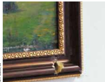
Одна из пуль попала в картину в кабинете директора.