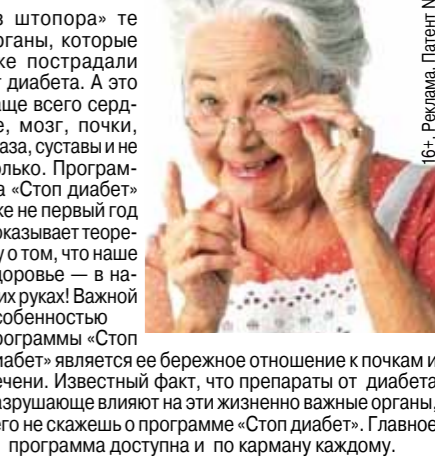
«Жизнь без власти диабета» 8 800 333 83 03

Диабет — не просто высокий сахар в крови. Он угрожает буквально всем органам и системам. Это полиомасштабная диверсия, развернутая против организма. Ущербная сладкая кровь разъедает сосуды и нервы. А ведь они пронизывают весь организм, который в итоге балансирует на краю бездны! Диабет — это черный лидер по числу заблудивших-случивших: это инфаркты и инсульты, гангрена, слепота, отказ почек и т.д. Риск преждевременной смерти у больных этим заболеванием почти в 3 раза выше, чем у остальных! Как выбраться из капкана под названием «диабет»? Как выжить? Ответ есть! И главное тут — бороться за свою жизнь и ни в коем случае не опускать руки! Важно не просто снижать сахар, но и «выводить