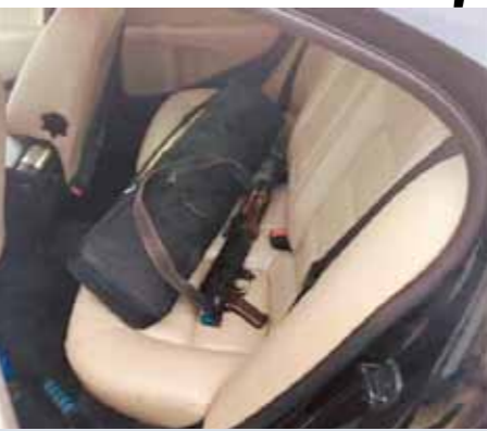
Карабин, из которого были убиты бизнесмены.