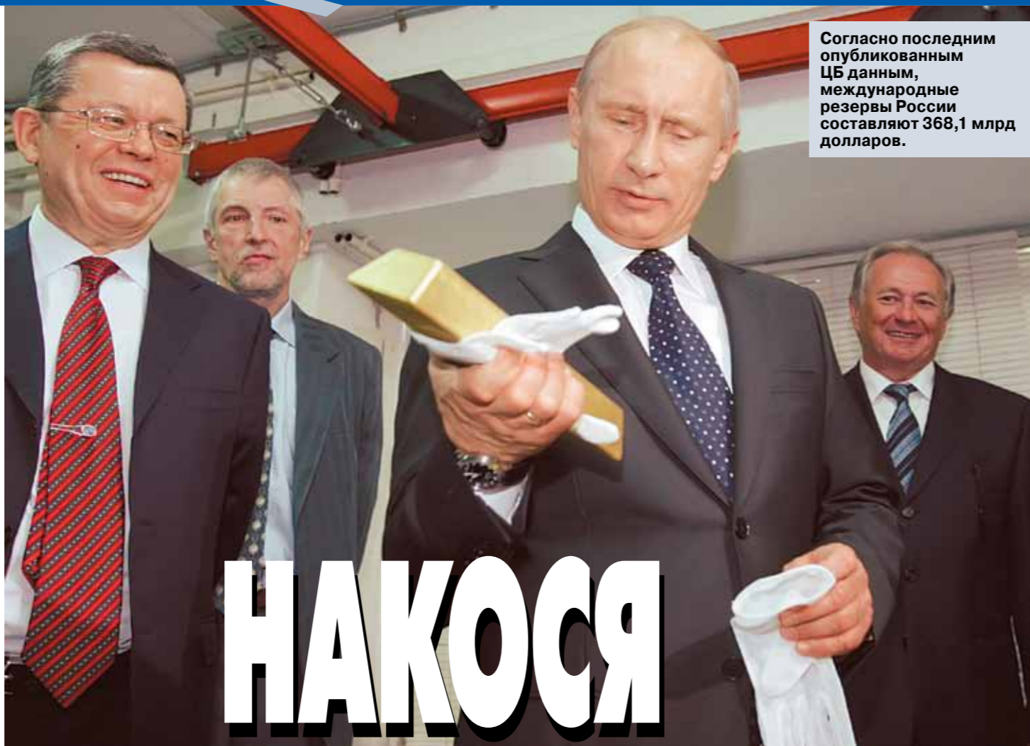
Согласно последним опубликованным данным, международные резервы России составляют 368,1 млрд долларов.

Иными словами, своей собственностью Российская Федерация может начать лишаться еще до того, как голландская Фемида поставит в деле последнюю точку. Причем не факт, что нам его возвратят, если вердикт Третейского суда будет отменен. Конечно, законодательство большинства цивилизованных стран предусматривает возможность пересмотра ранее вынесенного вердикта при появлении новых существенных обстоятельств. И отмена решения коммерческого арбитража к таким обстоятельствам, безусловно, относится. Однако никакого автоматизма здесь нет. Придется обращаться в те самые суды, экспроприировавшие российское госимущество, и тут уж как пойдет. «В этом случае будет новый процесс, — предупреждает профессор Лабин. — Судьи будут заново рассматривать дело и учитывать всю совокупность фактов и правовых норм».