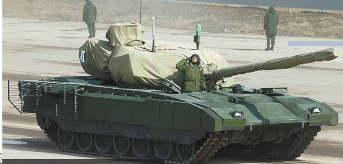
Танк Т-14 на платформе «Армата». Он предназначен к использованию в качестве нового основного боевого танка российских сухопутных войск с принципиально новыми тактико-техническими характеристиками.

Минобороны РФ впервые выложило в широкий доступ фотографии уникальной военной техники, которая пройдет по Красной площади на 70-летие Великой Победы. Всего по брусчатке главной площади страны пройдет около 190 единиц танков, БТР, БМП и другого вооружения. «МК» решил показать семь главных новинок парада.