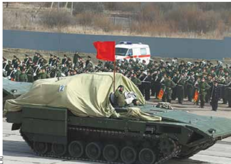
БМП Т15 на платформе «Армата». Это тяжелая гусеничная унифицированная платформа с принципиально новыми тактико-техническими характеристиками, с новым автоматом подачи боеприпасов.