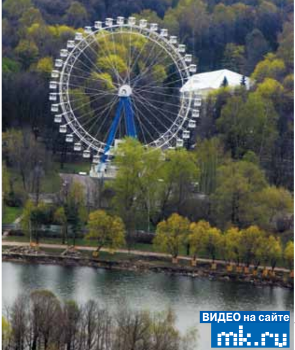
ВИДЕО на сайте mk.ru