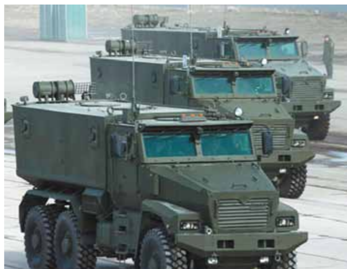
«Торнадо-У» — предназначена для перевозки личного состава, а также для установки различного целевого оборудования или систем вооружений.