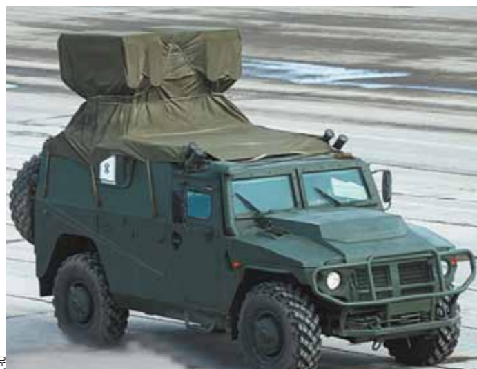
ПТРК «Корнет-Д» предназначен для поражения танков и других бронированных целей, в том числе оснащенных современными средствами динамической защиты. Модификация ПТРК «Корнет-Д» может поражать и воздушные цели.