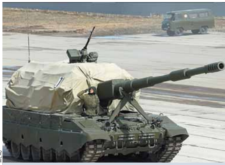
Самоходная артиллерийская установка «Коалиция-СВ». Это САУ также используют для передвижения шасси «Армата». «Коалиция-СВ» является перспективной заменой 152-мм самоходной артиллерии. Вместе с шасси масса САУ составляет менее 55 тонн.