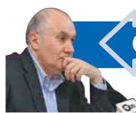
Матвей ГАНАПОЛЬСКИЙ, журналист, обозреватель «Эха Москвы»