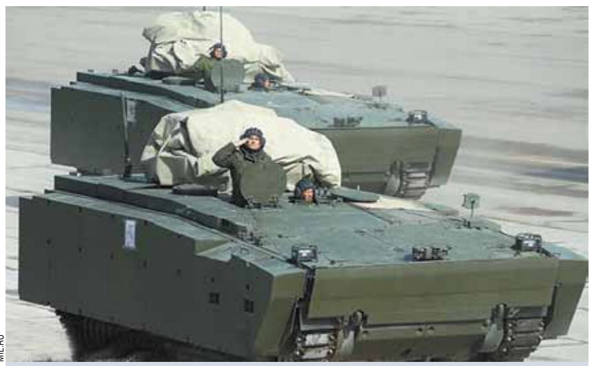
«Курганец-25» — перспективная средняя гусеничная платформа, которая является универсальной. На базе этой платформы планируется создать БМП, боевую машину десанта, гусеничный бронетранспортер и противотанковую самоходную установку. «Курганец-25» предназначен для замены существующих БМП, стоящих на вооружении Российской армии.