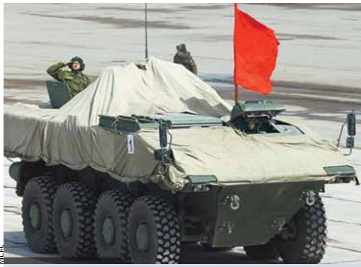
БТР «БУМЕРАНГ» — унифицированная боевая платформа, которая предназначена для транспортировки и поддержки огнем мотострелкового отделения. Эта машина может самостоятельно преодолевать водные преграды.