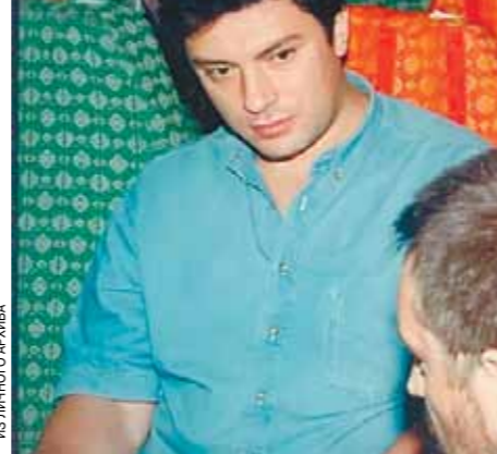
Будни первого вице-премьера Бориса Немцова. 1997 год.

Лилией Дубовой аккуратно в тот самый момент, когда они познакомились друг с другом. В марте 1997 года молодой нижегородский губернатор был назначен первым вице-премьером и сразу же отправился в рабочую поездку.