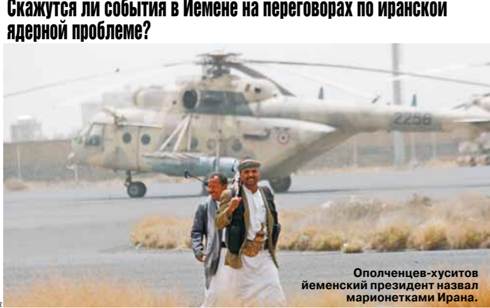
Ополченцев-хуситов йеменский президент назвал марионетками Ирана.