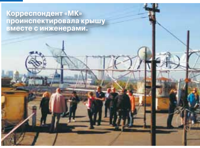
Корреспондент «МК» проинспектировала крышу вместе с инженерами.

После того как в ежемесячных платежах москвичей добавился графа на капремонт, многих волнует вопрос, когда и что они смогут получить за свои деньги. Фонд капитального ремонта многоквартирных домов провёл показательный рейд по одному из жилых зданий в центре. Специалисты разяснили, как будет происходить оценка состояния домов и приниматься решение о тех или иных работах.