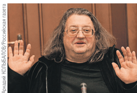
Аркадий КОЛЬБАЛОВ/Российская газета