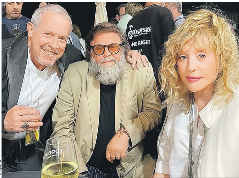
То самое фото с подписью «Три звезды...», где запечатлены Макаревич, Гребенщиков и Пугачева на форуме русской культуры в Израиле, на самом деле взорвало соцсети, а за ними и российские СМИ.

- Ой, ну живет тут Пугачева? И что? Вам-то зачем эта информация? - ворчит уже на мой вопрос продавщица из сувенирной лавки. Она, как выяснилось из Болгарии. - Что вы все к ней прицепились, ей-