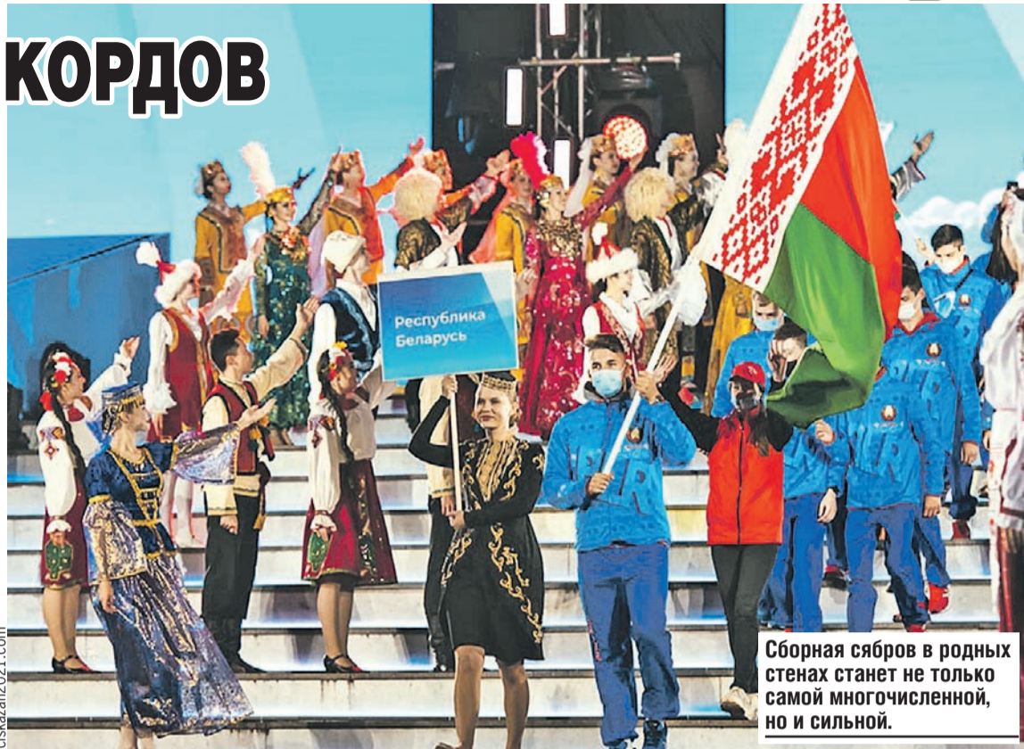
Сборная сябров в родных стенах станет не только самой многочисленной, но и сильной.

Игры пройдут в непростое для наших атлетов время. Спортсменов из России и Беларуси отстранили практически от всех международных стартов с пометкой «до особого уведомления». Поэтому для них игры станут главным стартом сезона. Что, в свою очередь, гарантирует захва-