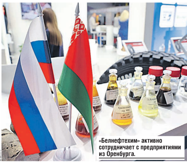
«Белнефтехим» активно сотрудничает с предприятиями из Оренбурга.

Следующим шагом ЕС решила сделать ограничения на поставку нефти и газа, но они снова подорожали, поскольку нашли новые покупатели. К примеру, Китай нарастил импорт больше чем на пятьдесят процентов. Россия опять побеждает.