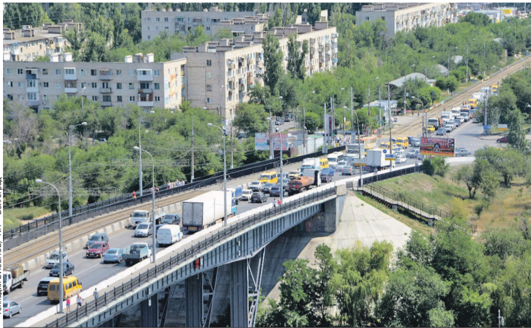
Все случилось под этим мостом, где частенько собираются местные подростки.

На берегу, судя по рассказу Ольги, взрослый дядька