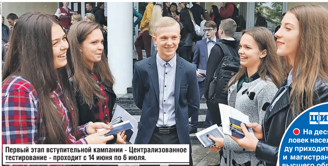
Первый этап вступительной кампании - Централизованное тестирование - проходит с 14 июня по 6 июля.

работать разумный баланс между универсальностью знаний, их фундаментальным характером и ориентированностью на потребности реального сектора экономики. Что поможет достичь поставленной цели?