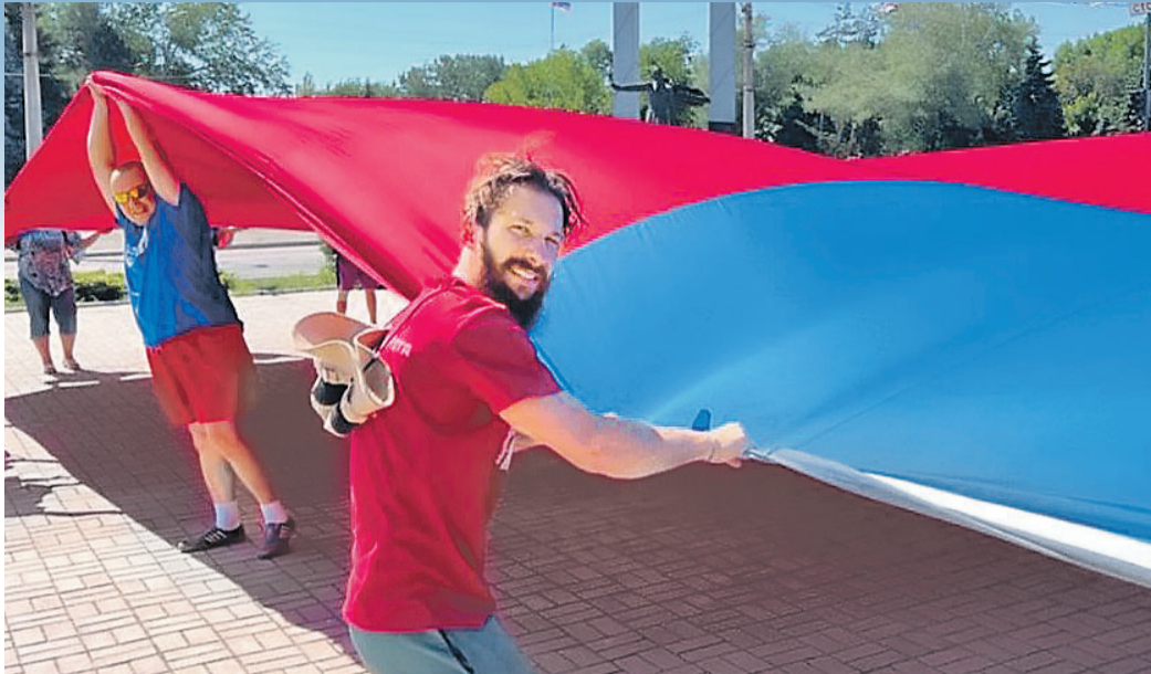
В Мариуполе пронесли самый большой российский флаг площадью 2,4 тысячи квадратных метров.

Отмечали праздник и за границей. Несмотря на культивируемую Западом русофобию, российские флаги появились на крышах домов в разных городах Германии, поздравления из ФРГ заполнили соцсети. На Кипре в Лимасоле прошел автопробег - авто украшали российские флажки. В индийском городе Патна на улице вышли двести человек с поздравительными плакатами, огромный триколор украсил парк Тель-Авива. Сотни русскоязычных американцев весело пошумели в честь праздника в пригороде Нью-Йорка. Ну и так далее... Как бы кому ни хотелось, отменить Россию просто невозможно.