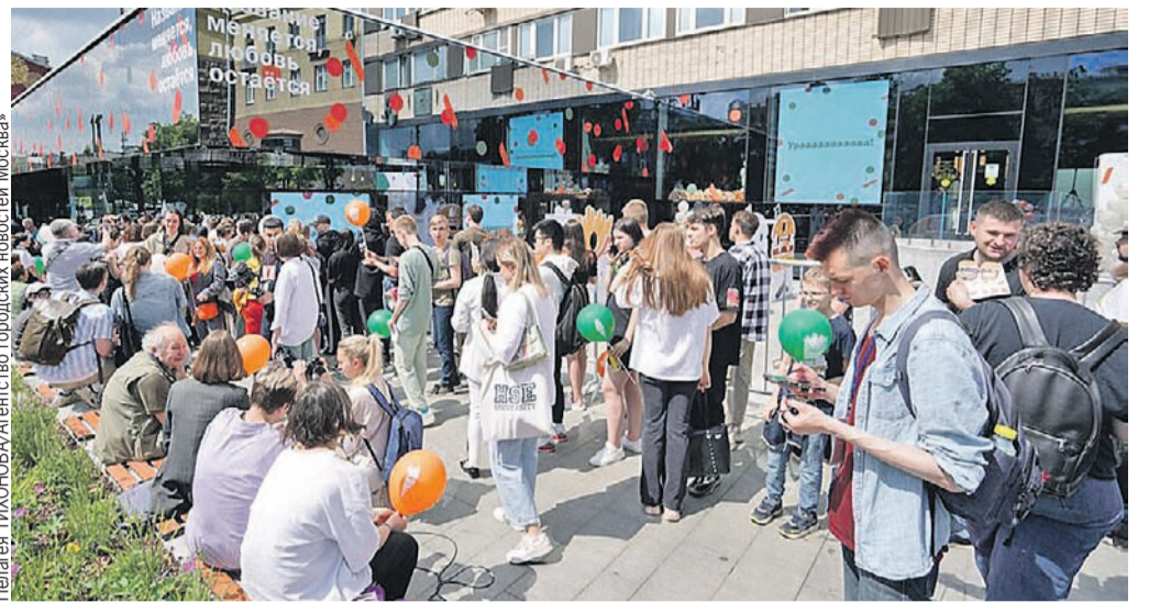
Ажиотаж на открытии сменщика McDonald's под названием «Вкусно - и точка» напоминал очереди в американскую закусочную 32 года назад.