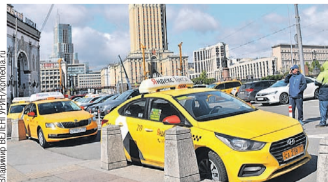
Теперь ездить наедине с незнакомцем станет безопаснее.

Запрещает закон бывшим уголовникам садиться и за руль автобусов, троллейбусов, трамваев. Но только тем, кто был осужден за тяжкие и особо тяжкие преступления - для средних сделали исключение.