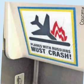
Стикер с пожеланием смерти русским.

Вообще-то речь идет о прямой террористической угрозе. Неужто Запад и на это закроет глаза в угоду «отстаивающей свободу» Украине?