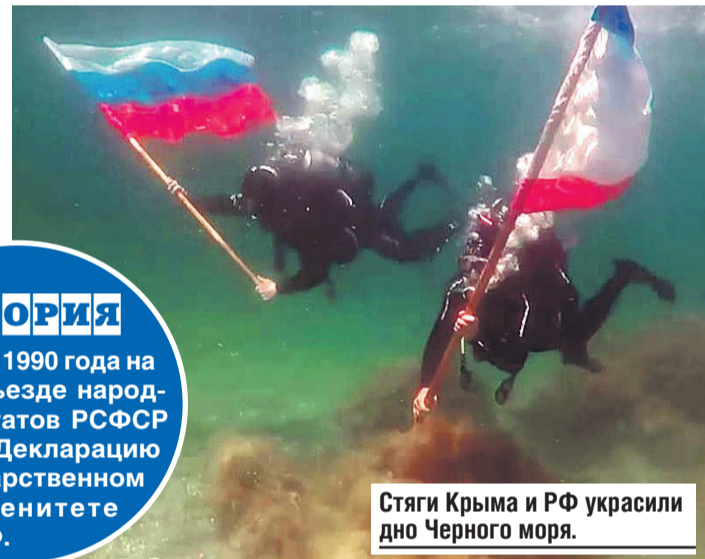
Стяги Крыма и РФ украсили дно Черного моря.