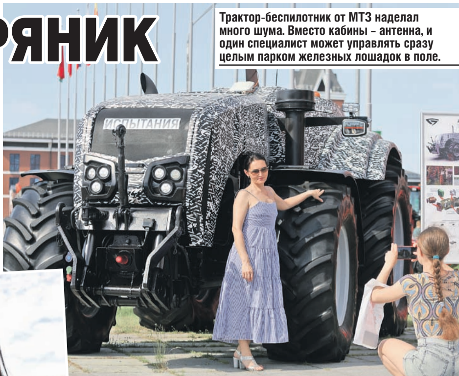
Трактор-беспилотник от МТЗ наделал много шума. Вместо кабины - антенна, и один специалист может управлять сразу целым парком железных лошадей в поле.

Россияне прилетели к нам из Хабаровского края, Сахалина, Приморья - из самых отдаленных регионов. Больше тридцати делегаций. Не просто посмотреть, а заключить контракты на поставку продуктов и техники. Ожидания оправдались. Форум превзошел прошлогодние по количеству участников и гостей, - сказал министр