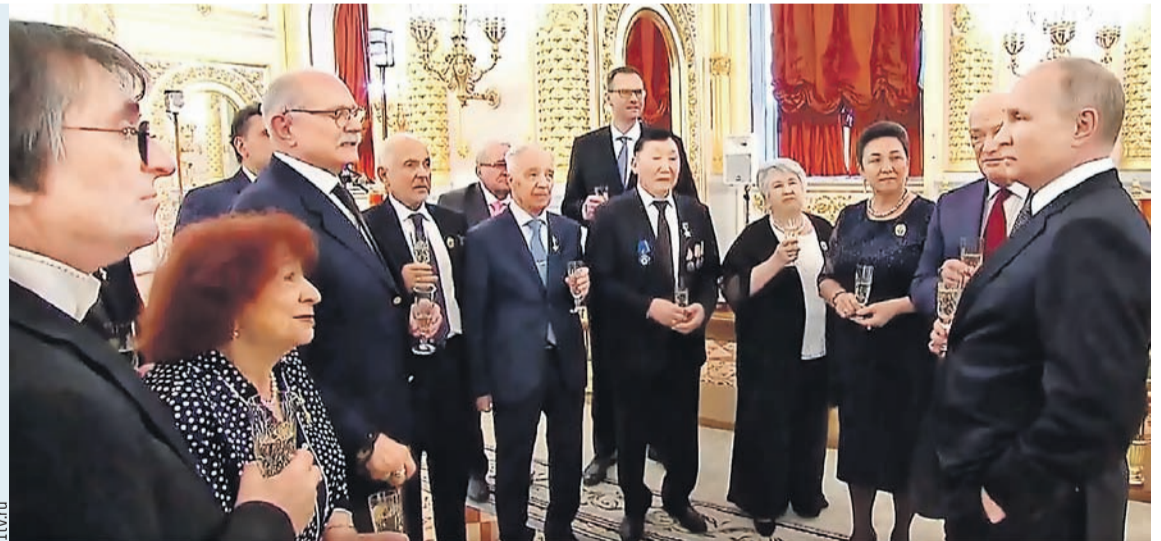
Завершилась торжественная церемония общения президента с награжденными за бокалом шампанского. Никита Михалков рассказал анекдот:

- Вы, - обратился он к Владимиру Путину, - очень раздражаете наших, как их называют, «партнеров» западных. А еще тех, кто двадцать с лишним лет назад думал, что в Кремль пришел послушный, выполняющий чужие желания чиновник. Господь управил так, что они ошиблись. С края пропасти двадцать лет страна уходила,