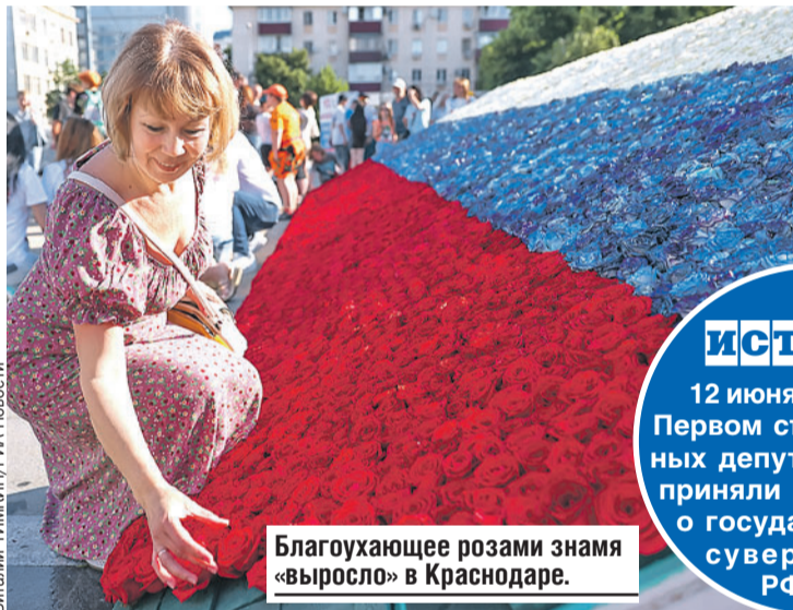
Благоухающее розами знамя «выросло» в Краснодаре.

Больше трех тысяч человек объединились в массовом хороводе на ВДНХ вокруг одного из самых узнаваемых фонтанов в стране - «Дружба народов». Также на легендарной выставке показали виртуозное мастерство всадники Кремлевской школы верховой езды.