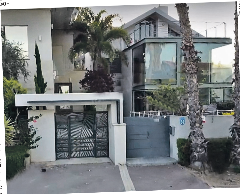
Дом, где живут Галкин с Пугачевой, конечно, далек от замка в деревне Грязь, но, судя по счастливым фото в соцсетях Максима, звездную чету это не сильно расстраивает.