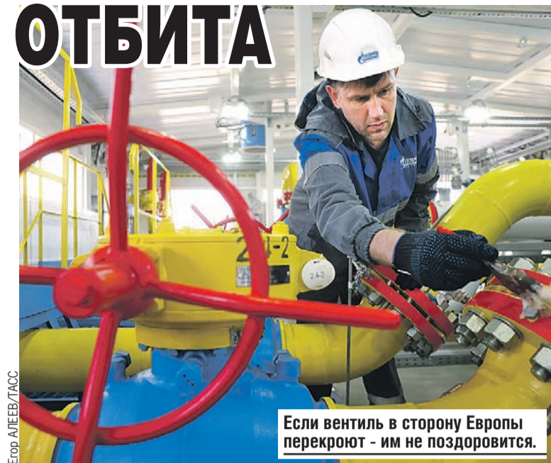
Если вентиль в сторону Европы перекроют - им не поздоровится.

22 апреля Еврокомиссия, скрипя зубами, приняла условия России, разрешив газовым компаниям торговать на ее условиях. Теперь можно подвести итог. К началу июня только шесть компаний отказались принять новые правила игры. Это польский концерн PGNiG, болгарский «Булгаргаз», финская компания Gasum, нидерландская GasTerra, датская Orsted Salg & Service и британо-голландская Shell Energy Europe. Причем не по своему желанию - им приказали это сделать местные политики. За строптивость придется платить.