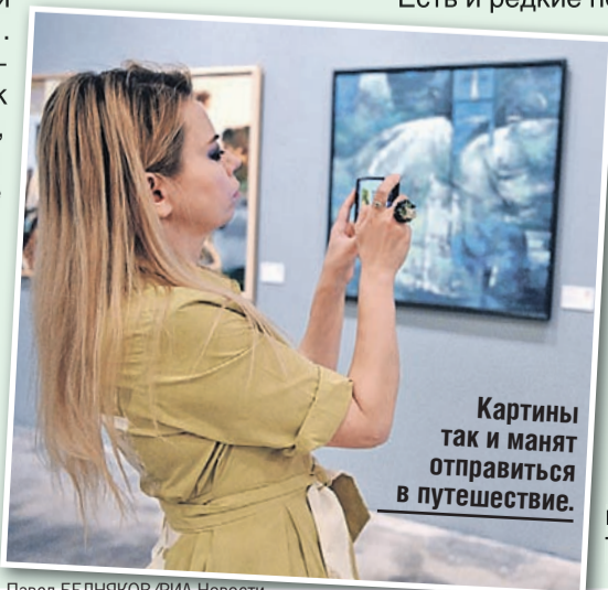
Павел БЕДНЯКОВ/РИА Новости

Открывшаяся экспозиция - это самый масштабный совместный проект в области изобразительного искусства наших стран.