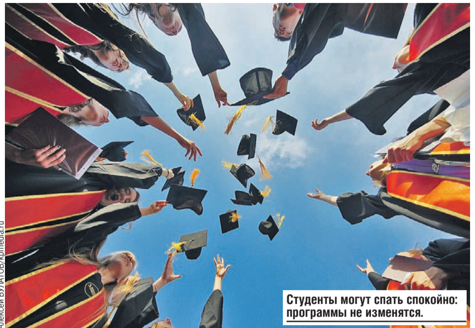
Студенты могут спать спокойно: программы не изменятся.

- Я думаю, это связано с качеством программ, с мотивацией студентов. Расхлябанность, увы, есть везде, и на специалитете тоже. Нужно работать над мотивацией ребят, над тем, чтобы программы были хорошо оснащены, интересны, чтобы студенты могли получать практические навыки, иметь связь с работодателями. А бакалавриат это, специалитет или магистратура - не имеет значения.