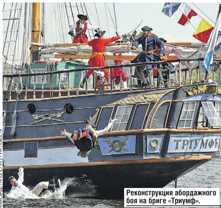
Реконструкция абордажного боя на бриге «Триумф».

«Мы просыпаемся. Какой ныне день? Петр велел считать годы от Рождества Христова, Петр Великий велел считать месяцы от января, - напоминает Погодин. - Пора одеваться - сукно выткано на фабрике, которую завел он; шерсть настрижена от овец, которых развел он. Вам нужно купить разные вещи - все они, от шелкового шейного платка до сапожной подошвы, будут напоминать вам о Петре Великом: одни выписаны им, другие введены им в употребление, улучшены, привезены на его корабле, в его гавань, по его каналу, по его дороге.