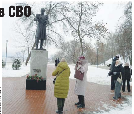
Монумент появился в Александровском саду.