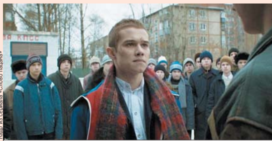
В сериале рассказывают о жизни молодежных банд в Казани 1980-х годов.

Отреагировал на происходящее раис республики Рустам Минниханов,