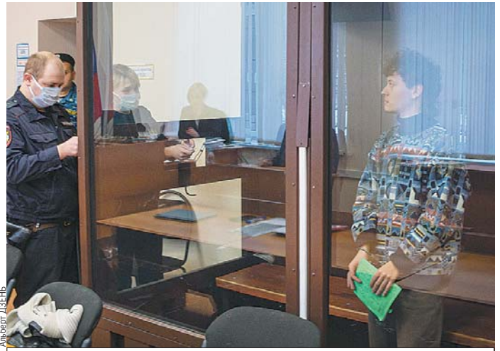
Эдуард решил «подкупить» судью стихами про Родину.

Музыкант попросил прощения за свои выходы. Сделал он это в виде