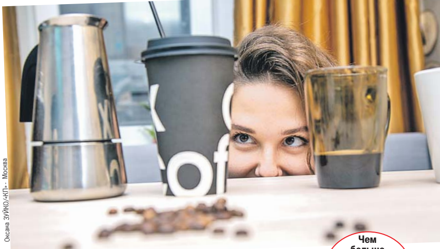
Оксана ЗУЙКО/КП - Москва

Чем больше изучают кофе, тем интереснее этот напиток становится.