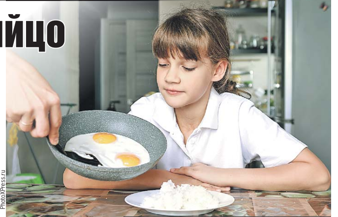
Мечтал яички буржуин отправить за кордон. Но депутаты экспорту поставили заслон. Теперь они, дешевые, на завтрак к нам пришли, И много-много радости детишкам принесли! (Исполняется с ехидным смехом и скептическим выражением лица.)