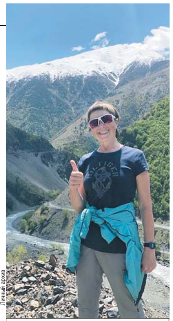
Тольяттинка путешествовала автостопом.

Через два месяца «Бешеная белка» снова собирается в путь. Из Колумбии хочет пройти на яхте до Мек-