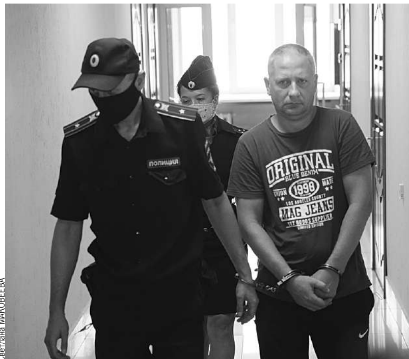
Мужчина свою вину так и не признал.