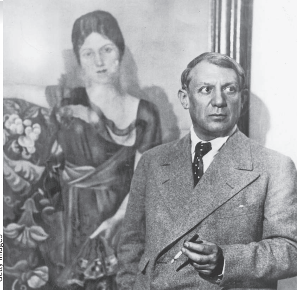
Пабло Пикассо и «Портрет Ольги в кресле».

шает уйти от Пабло, но тот, не желая по закону отдавать половину своего имущества жене, отказывает ей. «Каждый раз, когда я меняю женщину, я должен сжечь ту, что была последней. Таким образом я от них избавляюсь. Это,