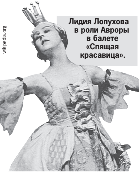
Лидия Лопухова в роли Авроры в балете «Спящая красавица».

Для Кейнса Лидия стала главным советчиком, секретарем, а со временем и сиделкой. Вместе они провели 21 год. После смерти любимого Лопухова прожила еще 30 лет, но в это время избегала общества и после себя ни оставила ни дневников, ни мемуаров.