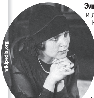
Эльза Триоле часто чувствовала себя в тени своей сестры Лили Брик.

Эльза Триоле родилась в Москве и долгое время носила имя Элла Каган. Еще совсем юной она познакомилась с Владимиром Маяковским , который сперва увлекся ею, но потом переключился на ее родную старшую сестру Лилию Брик .