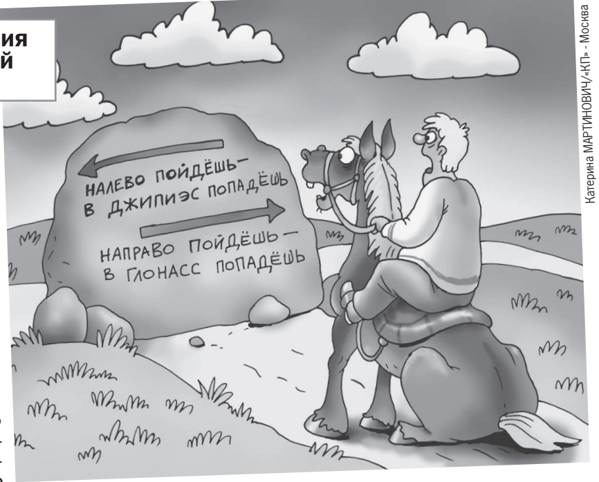
Катерина МАРТИНОВИЧУ-КП - Москва

Причем в последние годы ГЛОНАСС ставится на смартфоны и автомобильные навигаторы по умолчанию. На нем же рабо-