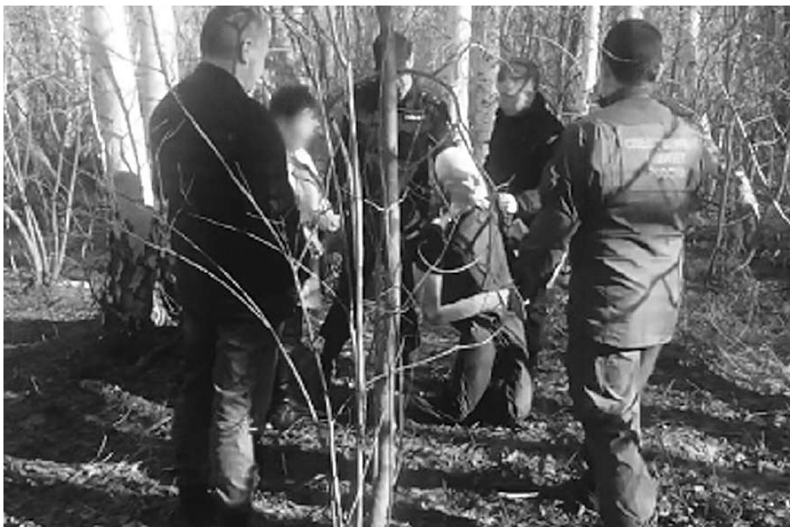
На следственном эксперименте мать показала, как душила и закапывала сына, но ни разу не назвала его по имени.