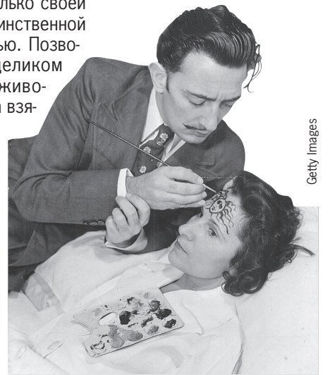
Дали рисует на лице Галы изображение горгоны Медузы, которая могла взглядом превратить в камень.

Гала не была образцом нравственности. Ее многочисленные романы молодости продолжались всю жизнь, несмотря на брак с Дали. Чего стоит ее интрижка с американским певцом Джеффом Фенхольтом , который был моложе ее на 57 лет.