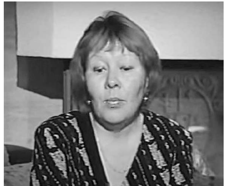
Гульназ больше 20 лет играла роль безутешной матери, скрывая страшную тайну.

- В лесу он стоял ко мне спиной. Я подошла сзади и задушила его поясом от халата, а потом пошла домой. Дома меня муж спросил: «Ну, как?». Я ответила, что убила его. Муж спросил, закопала ли я его, я