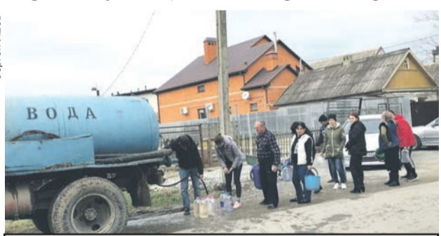
В каждый район приехали цистерны с водой.