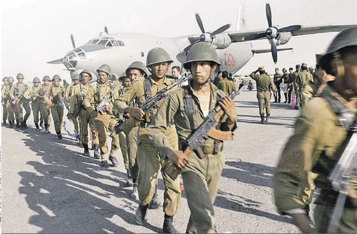
Советский спецназ высаживается в Афганистане. Весна 1988-го.

В самом СССР эта война поначалу держалась в секрете. Газеты и телевидение хранили молчание о ее размахе и потерях, сообщая лишь об исполнении «интернационального долга» в Демократической Республике Афга-