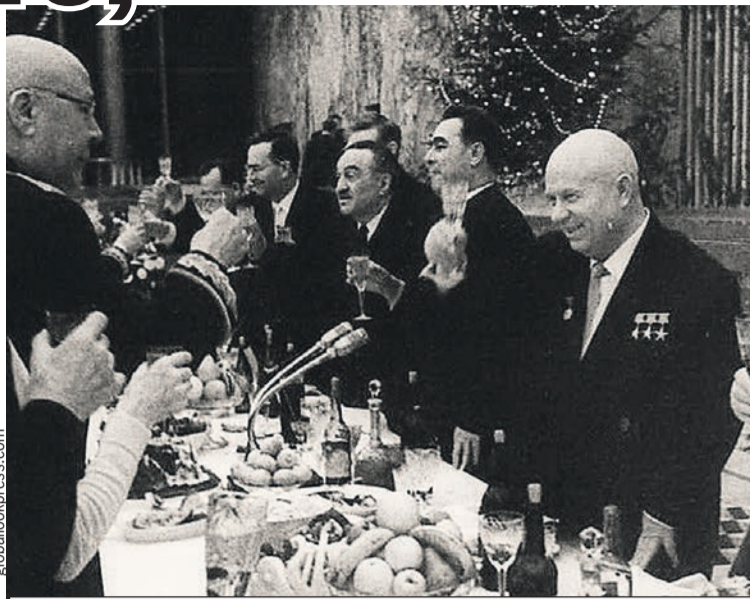
Маршал Советского Союза Семен Тимошенко (на фото - слева) поздравляет первого секретаря ЦК КПСС Никиту Хрущева с Новым годом. Справа от Никиты Сергеевича - его соратники Леонид Брежнев и Анастас Микоян. Москва, Кремль, декабрь 1963 г.

Постышев так и сделал: осудил «левый елочный загиб» и рекомендовал «положить ко-