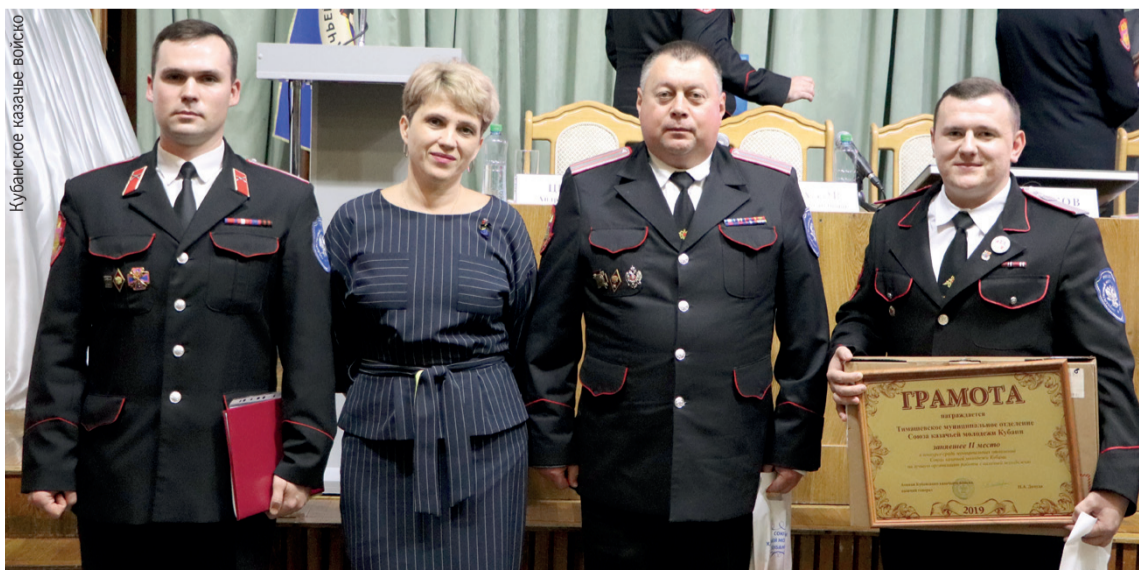
Призеры краевого конкурса «Лучшая организация работы с казачьей молодежью» - Тимашевское отделение Союза казачьей молодежи Кубани.

Главным итогом Координационного совета стали награды. Лидеры молодежного движения, атаманы школ в момент получения грамот, ценных подарков благодарили атамана Всероссийского казачьего общества и Кубанского казачьего войска словами «Служу вере православной, казачеству и Кубани!».