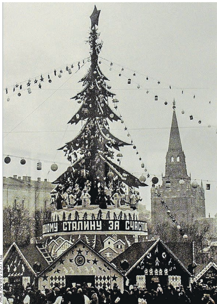
Москва, елка у Троицких ворот. В Кремле - товарищ Сталин, а на новогодней елке среди украшений - здравица в честь великого вождя. 1937 год.

Оказывается, в то время государь заложил не один, а целых три Александровских сада - Верхний, Средний и Нижний - от Угловой Арсенальной до Водовзводной башни: для «красоты и прогулок и праздных забав». Сегодня сад перестали делить на части: теперь он просто один Александровский. Но 200 лет назад народ охотнее всего шел именно к верхней большой рождественской и новогодней елке - у декоративного грота «Руины».