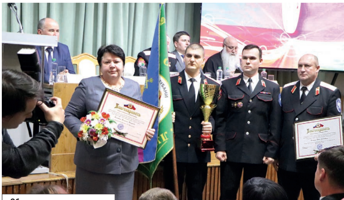
Обладатели переходящего знамени «Лучшее муниципальное отделение» - Крымское отделение Союза казачьей молодежи Кубани.

- Не обязательно все учащиеся казачьих школ и кадетских корпусов будут атаманами. Кто-то станет врачом, кто-то инженером, кто-то фермером. Молодые