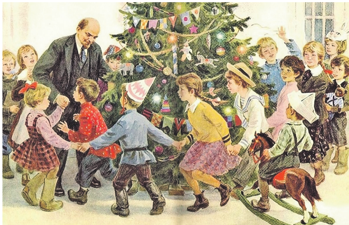
Детский новогодний хоровод с дедушкой Лениным. Поздравительная открытка. 1950-е годы.

ной хороминой на Красной площади, в Тайницком саду у зданий Старых и Новых приказов и у Лобного места, перед Спасскими воротами.