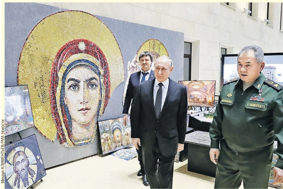
Владимир Путин приехал во вторник на ежегодную коллегию Минобороны. А перед этим Сергей Шойгу провел президента по выставке, на которой были не только новые вооружения, но и образцы внутреннего убранства Главного храма Вооруженных сил, который строится в Подмоскowie к 75-летию Победы.

- Я пью даже не чай, а заваренные, облитые кипятком травы с Алтая.