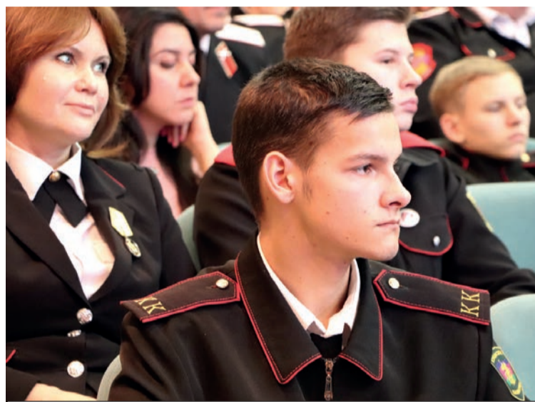
Атаманы казачьих школ также присутствовали на Координационном совете.

- За прошедший год Союз провел несколько десятков мероприятий. В особо знаковых ребята участвуют