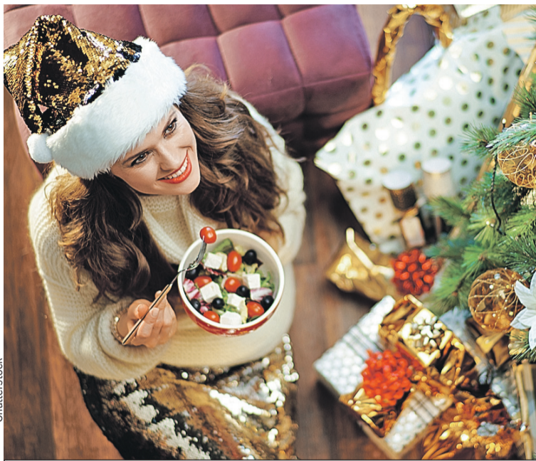
Даже полезной закуски должно быть в меру.

цепт. Картофеля кладите самый минимум, как будто это дорогой деликатес. Во-вторых, вместо покупного майонеза возьмите более легкую заправку (например, греческий йогурт или сметану) или сделайте домашний майонез. Так вы будете знать, что использовали самые свежие и натуральные компо-