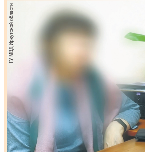
Только в разговоре с дочерью пенсионерка поняла, что попала на уловку аферистов.

Обманщики продолжали давить на пенсионерку и требовали, чтобы она не общалась и не советовалась с родственниками. Запугивали слезкой. Спустя несколько дней дочери заметили странное поведение матери и приехали в гости. В разговоре с ними женщина, наконец, поняла, что попала на уловку мошенников. Всего она потеряла почти два миллиона рублей.