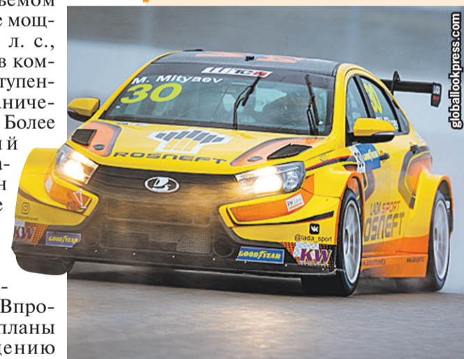
Вот какой облик может принимать Vesta Sport! Правда, в салоне такую не купишь - это чисто гоночная версия.

Продемонстрировали президенту и вариант новой «Нивы» - пока лишь в виде полноразмерного макета и с необычным названием «Т-134». Тут, впрочем, до постановки на конвейер далеко. Зато в 2027-м на него встанет минивэн Lada. Подробностей о последнем еще меньше, чем о кроссовере.