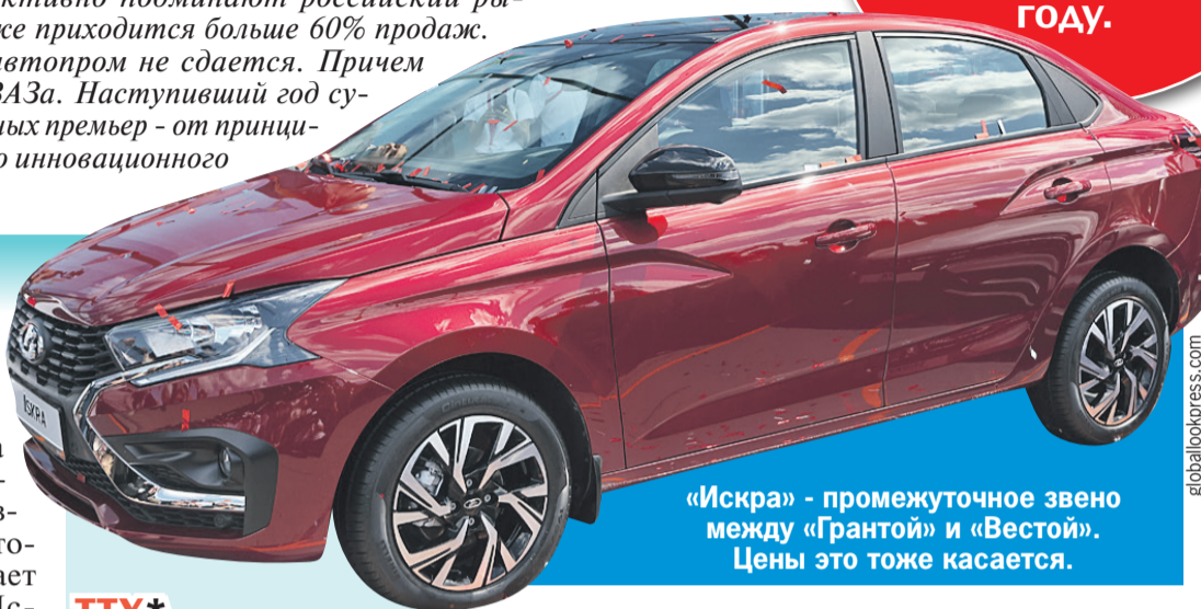
«Искра» - промежуточное звено между «Грантой» и «Вестой». Цены это тоже касается.

Планировалось, что на базе этой платформы будут выпускать новые Logan и Sandero, а АвтоВАЗ получит возможность на ее основе разработать второе поколение «Гранты», - рассказывает автоэксперт Игорь Моржаретто. - Но в 2022 году французы ушли, и до-