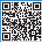
Фото присылайте в «Комсомольскую правду», e-mail: miss@kp.ru

Голосуйте за понравившуюся вам участницу на нашем сайте KPRU в разделе «Будь стильной с «КР»!»