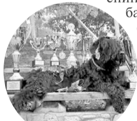
Юстиция хвастается наградами.