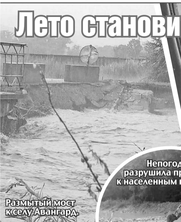
Размытый мост к селу Авангард.