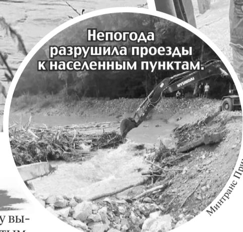
Непогода разрушила проезды к населенным пунктам.