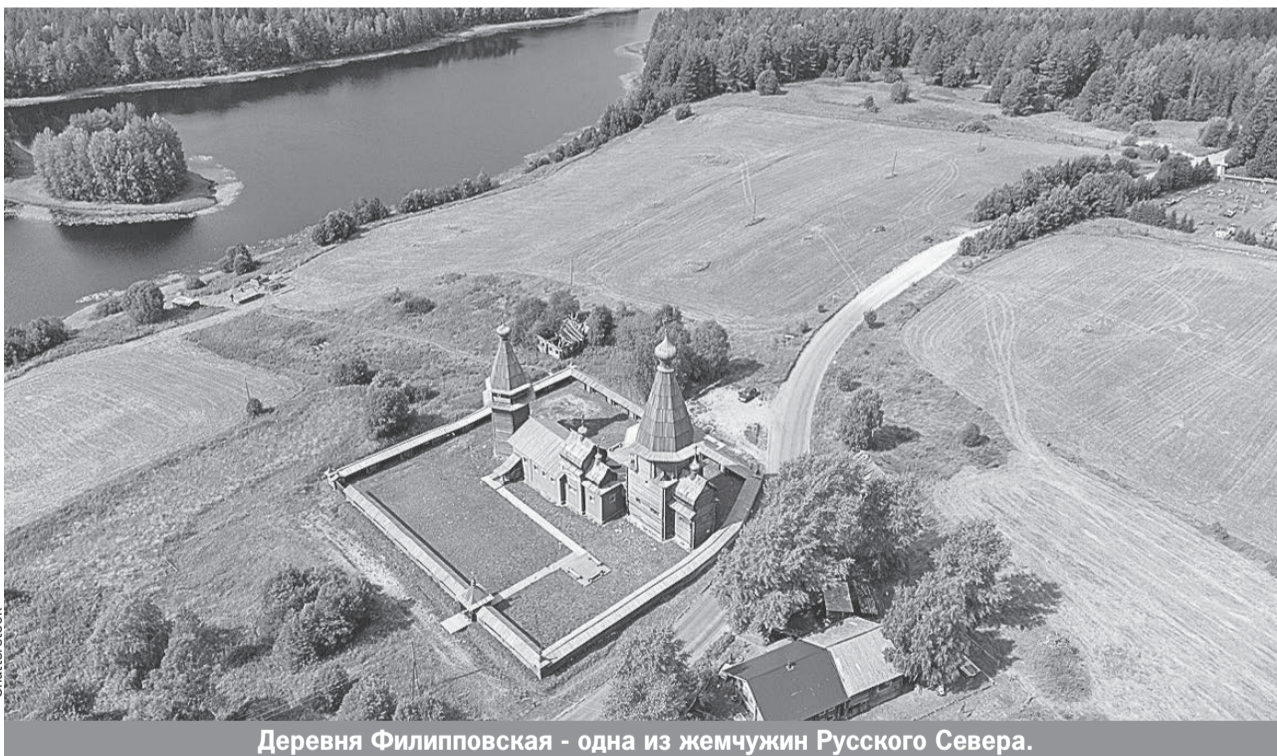
Деревня Филипповская - одна из жемчужин Русского Севера.

- Эта заповедная территория хранит не только архитектурные шедевры русских зодчих, но и живые духовные и культурные традиции, - подчеркнул постоянный представитель