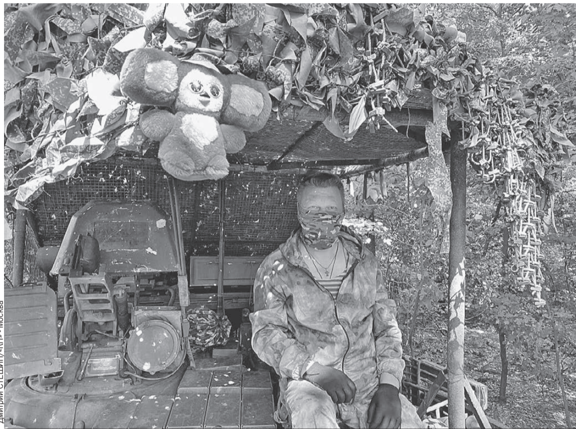
«Курган» уже не молод, но под маской у него почти всегда скрывается улыбка.

- Есть. Не подведу, товарищ «Курган», допилим «Терминатор» до идеала, пусть враг боится и завидует!