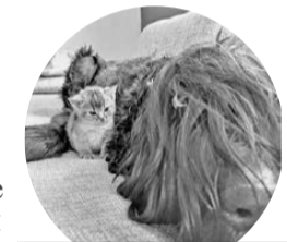
Пульхерия радуется компании даже ворчливого котенка.

Несмотря на заслуженный отдых, собаки хватку не теряют, по-прежнему оставаясь обученными сотрудниками силовых структур.