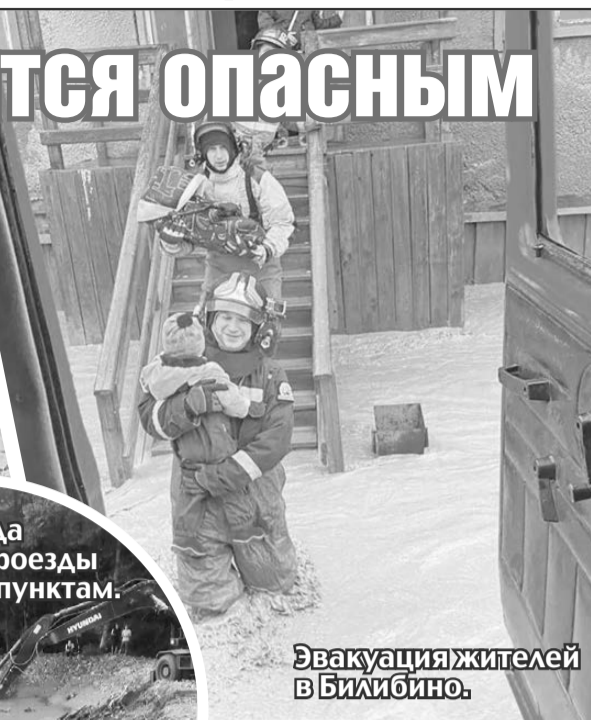
Эвакуация жителей в Билибино.