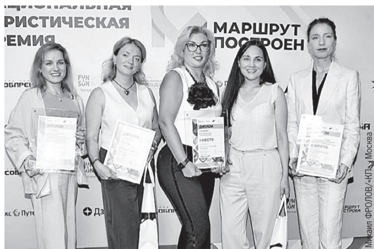
Промышленный туризм - одно из новых направлений познавательного отдыха.

металлургической компании. Этот проект завоевал 2-е место в своей номинации.