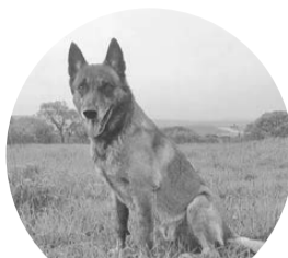
Пайк гуляет в поле.