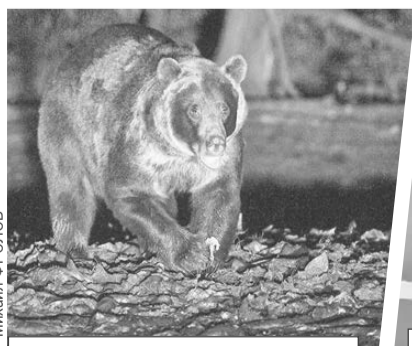
Медведей привлекают свалки пищевых отходов.