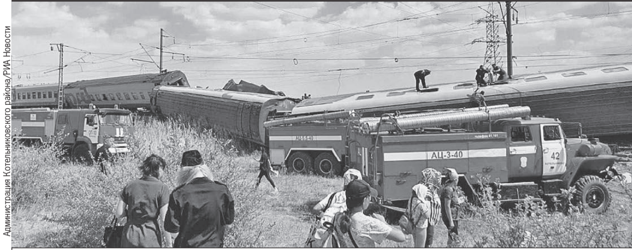
На место сразу съехались автомобили оперативных служб. Главное - помочь людям.