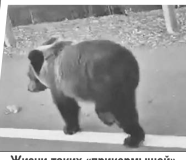
Жизни таких «прикормышей» почти всегда обрываются трагически.

ки от людей или питаюсь на помойках. И в этот раз он выбрал наиболее простой для