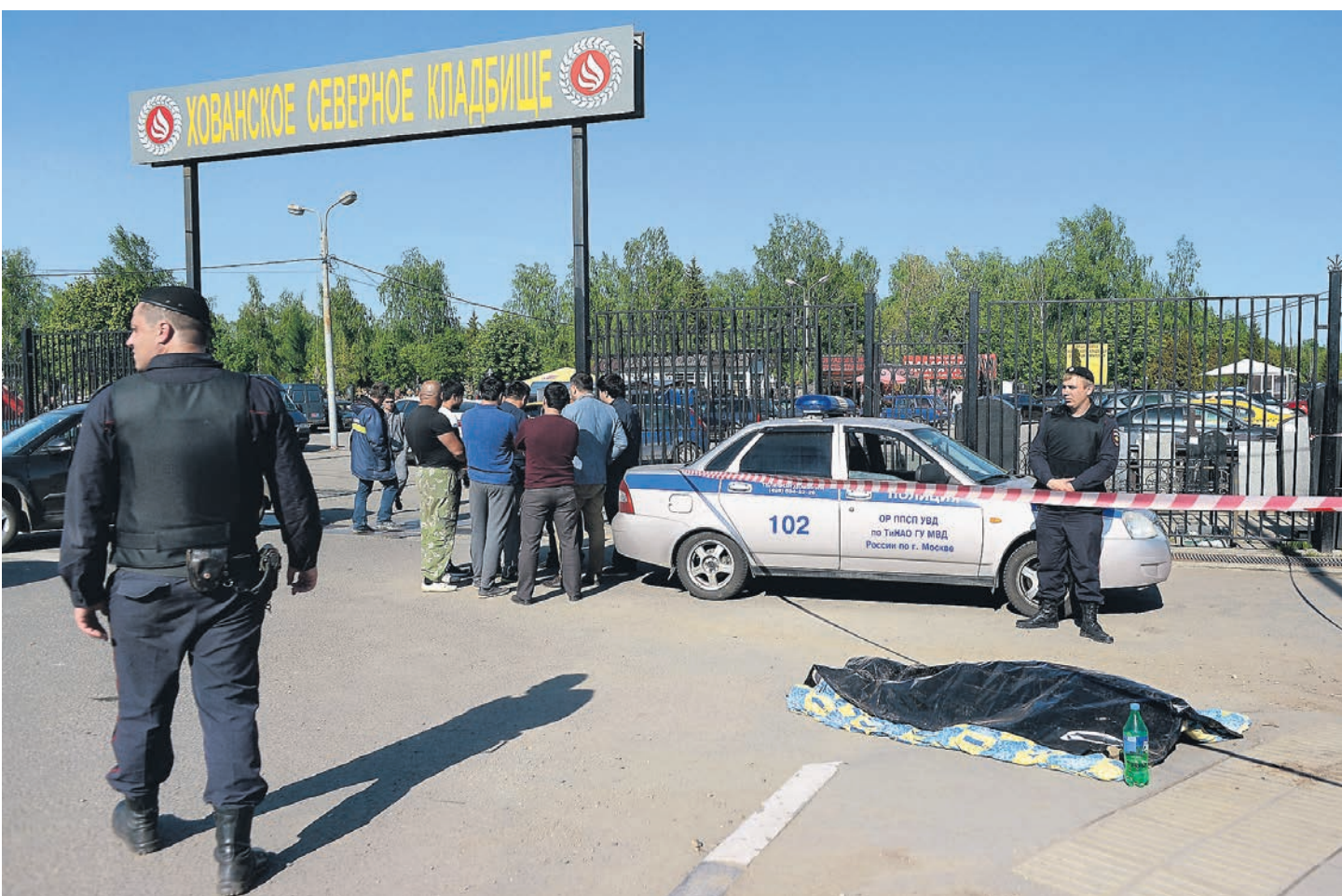
Полиции пришлось задействовать огромные силы, чтобы пресечь побоище на Хованском кладбище

спорт | «Зенит» сложил полномочия чемпиона России — 12